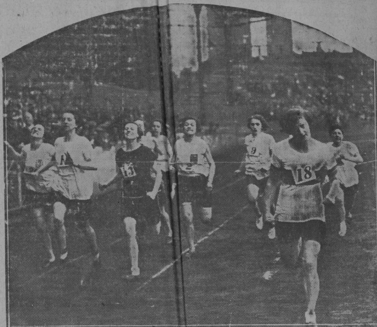
Un momento de la carrera femenina de las 20 yardas, celebrada en Stamford Bridge

Mondariz pase una semana en El Escorial.