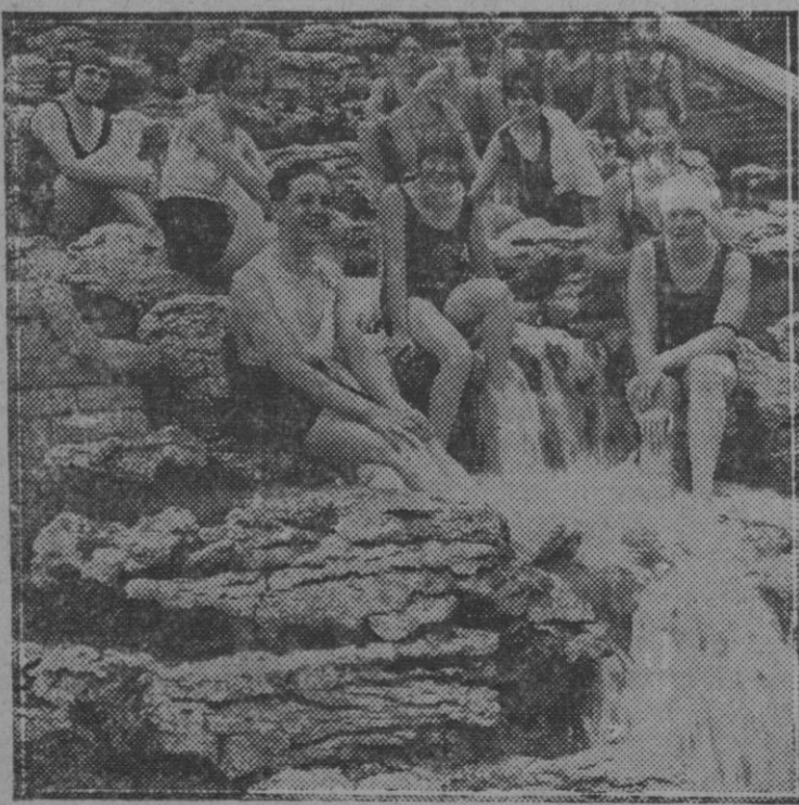
Bañistas en Sculphort (Inglaterra) tomando baños. El sol y el agua reconfortan y embellecen