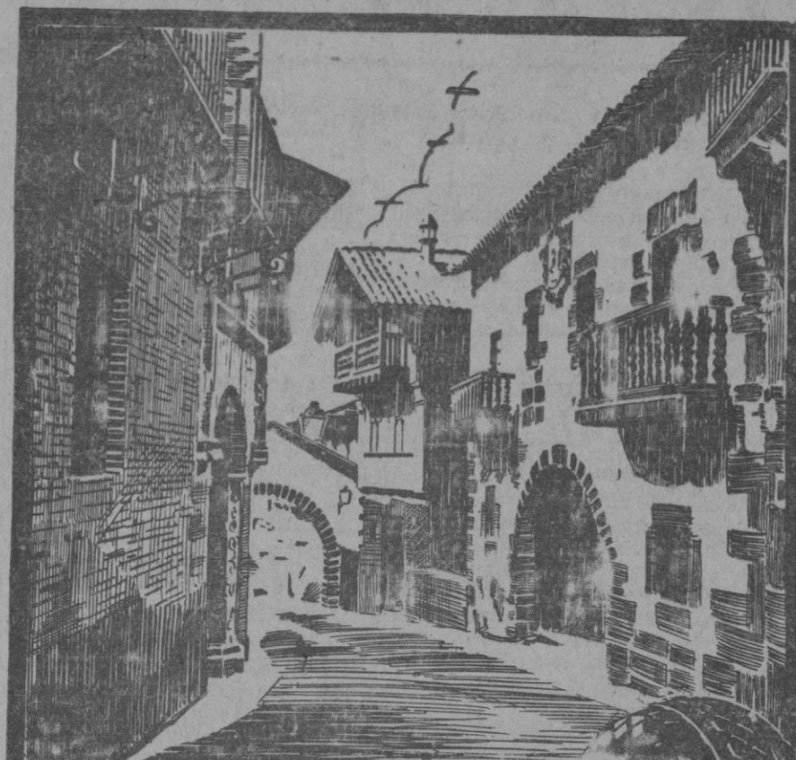
Exposición de Barcelona, Pueblo Español

Se organiza un banquete para solemnizar el triunfo.