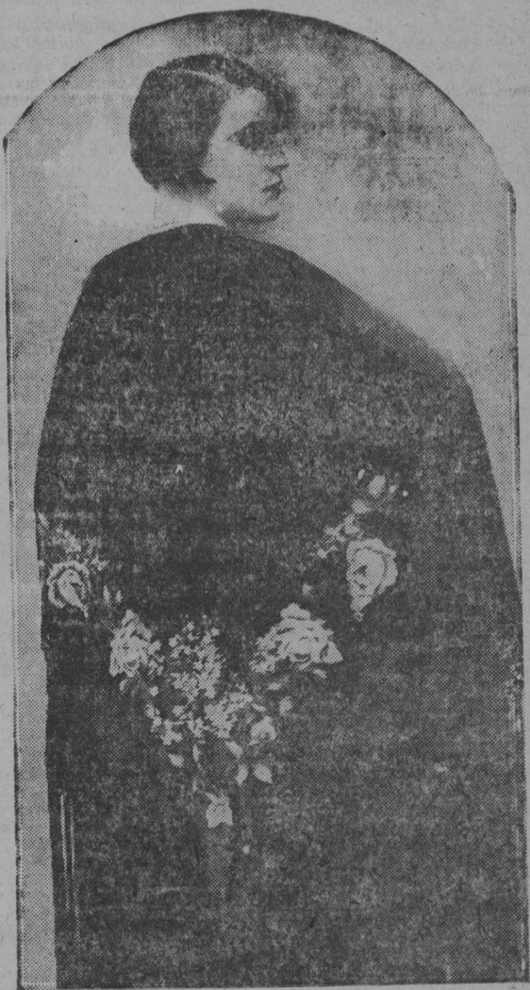
Ultimo grito: «Eoharpe» con grandes flores

En la iglesia de la Piedad, por la tarde, a las cinco menos cuarto, continuará el solemne popular mes de María, con exposición del Sagrado Capón. Visita A Nuestra Señora de la Paz en San Jaime. En San Francisco La Juventud Seráfica celebrará hoy con toda solemnidad la fiesta del mes de María que consagra a su excelsa Patrona la Inmaculada Virgen María con los siguientes cultos.