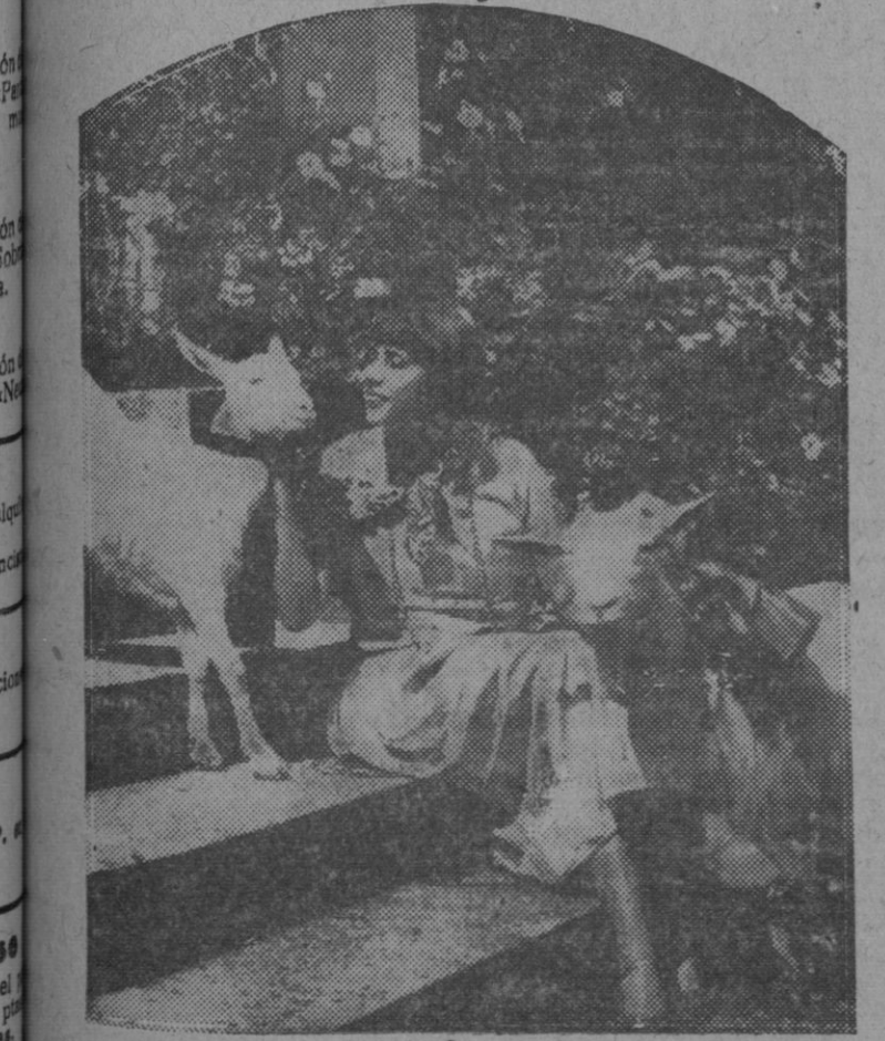
La popular Mistinguette, sorprendida en su jardín en una íntima escena