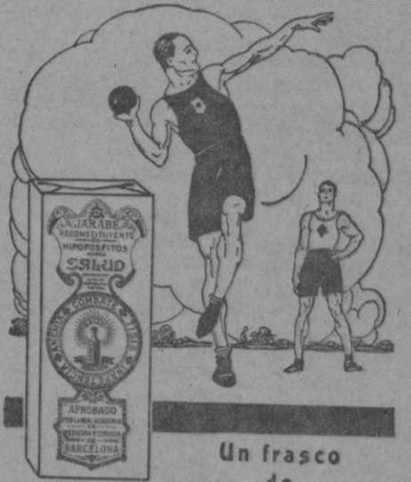
Un frasco de