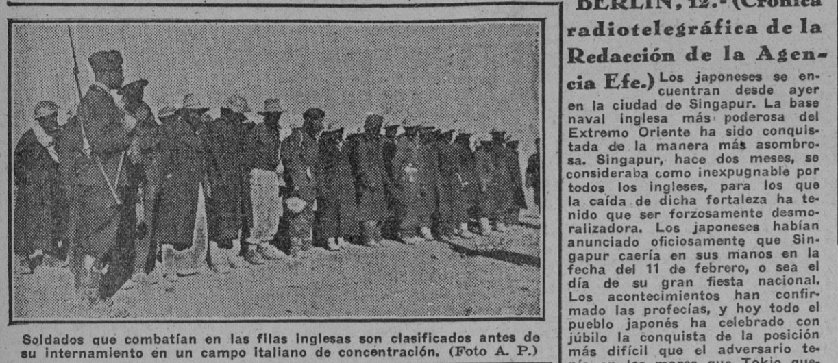
Soldados que combatían en las filas inglesas son clasificados antes de su internamiento en un campo italiano de concentración.