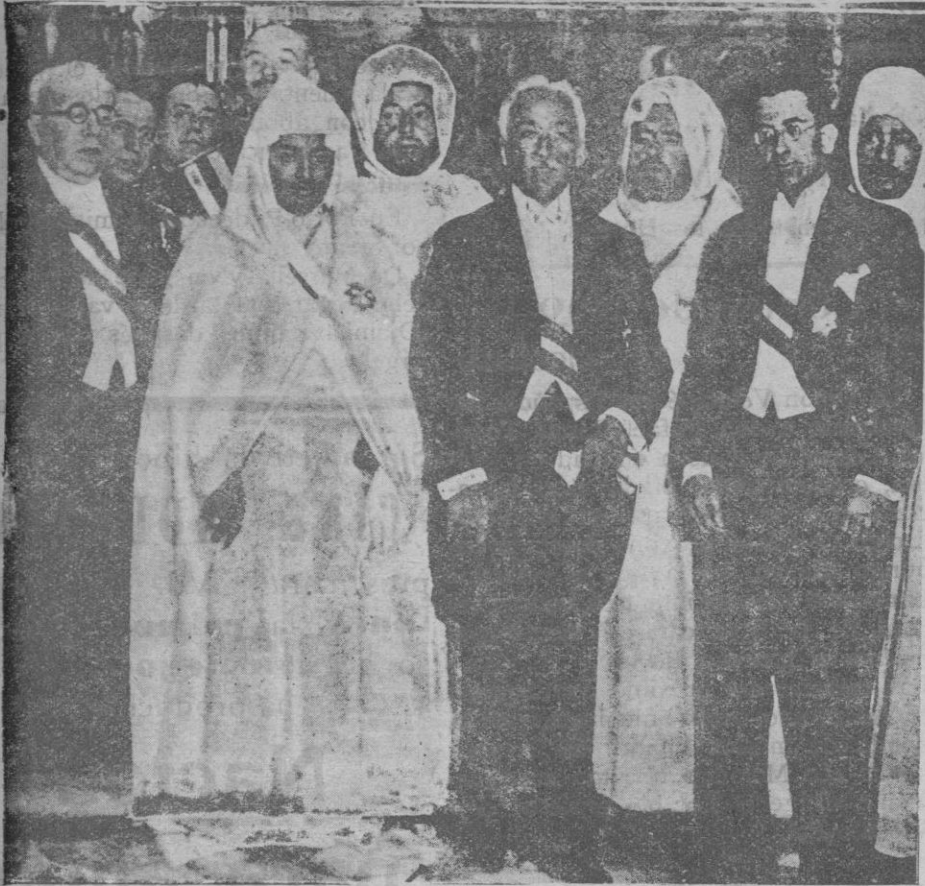
El Jalifa, con el Presidente de la República, el Jefe del Gobierno y el Ministro de Estado