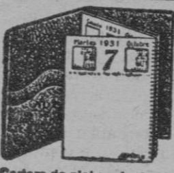
Tabla y Bloc 4.50 Bloc de 1.90 recambio 1.

El Bloc-Agenda de Mesa Spirax Muy práctico—Se hojea como un libro Se conserva todo el año encuadernado