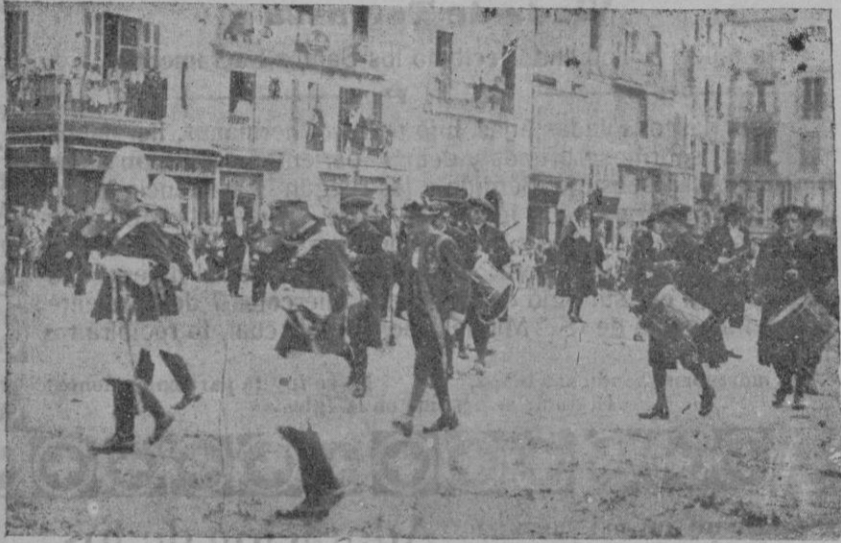
La Comitiva Municipal a su regreso de la Catedral