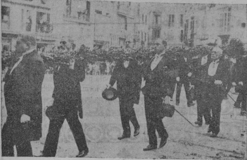
Los concejales llevando la histórica asta del Rey Conquistador