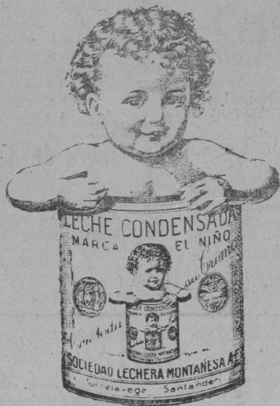
LA GRAN MARCA NACIONAL