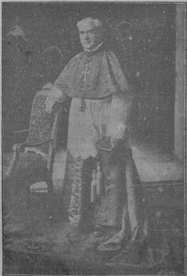
El Dr. D. Enrique Reig al ser nombrado Cardenal Arzobispo de Toledo

Un periodista que buscaba algunos datos en el censo de habitantes del Cáucaso durante el año 1926 encon-