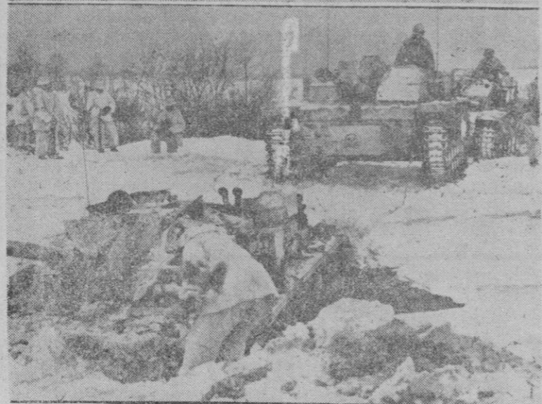
EL TANQUE Y EL HIELO.—Por la mejora del tiempo la capa de hielo ha perdido consistencia en el Este. Este tanque alemán ha caído al agua pero será salvado con la ayuda de los otros tanques. Este es el sintoma de la mejora constante del tiempo en el Este