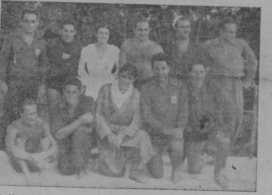
El C. N. Barcelona que venció en Water-polo y fué vencido por puntos en las carreras