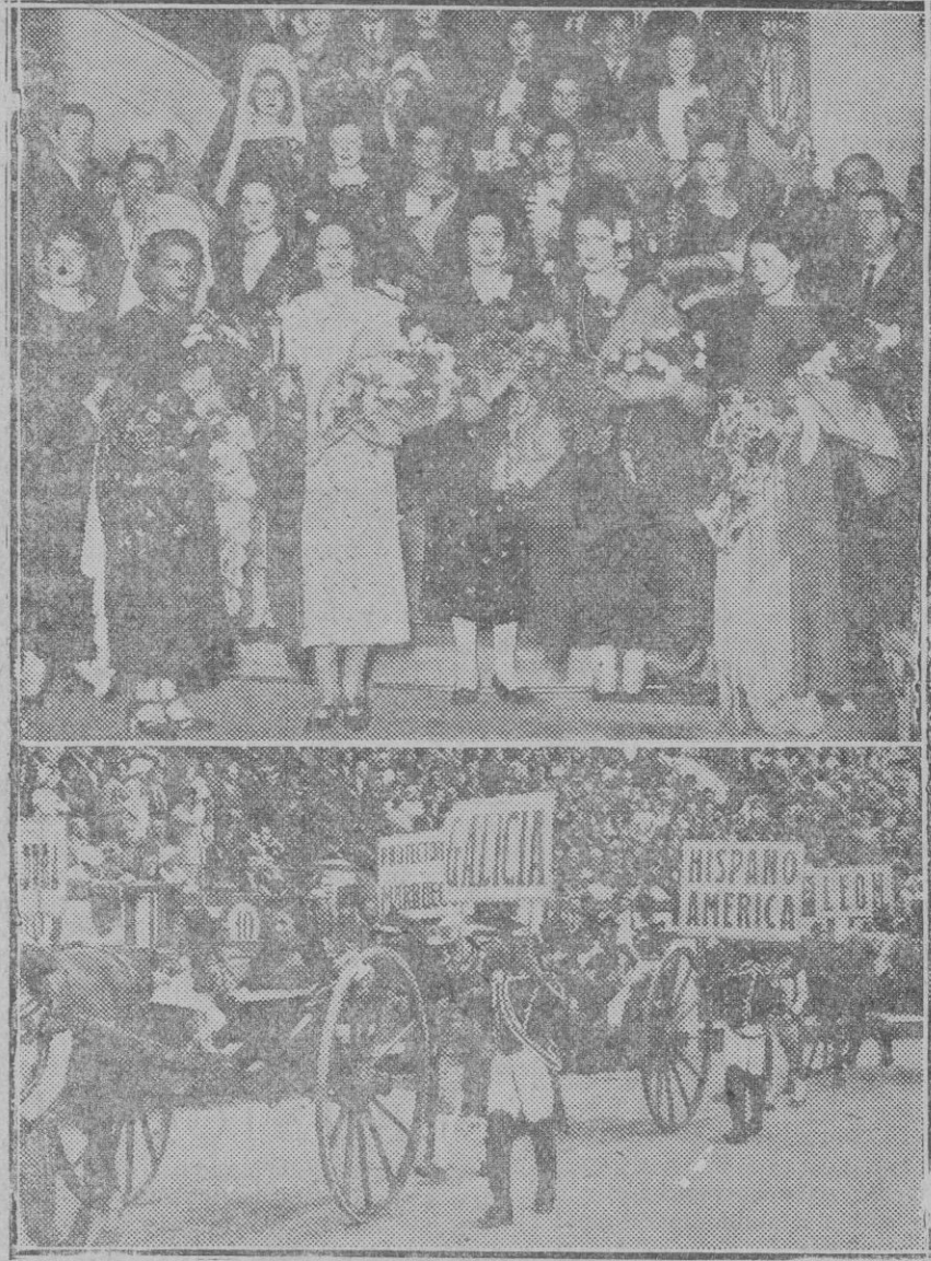
MADRID. — La corrida de toros en honor de las Mises. 1.º al salir las Mises del Hotel donde se hospedan.— 2.º Un aspecto de la plaza

La gestión de la Comisión de Ensanche es digna de todo elogio, pues a su actividad—que ojalá fuera la característica de toda gestión pública—une un indudable acierto.