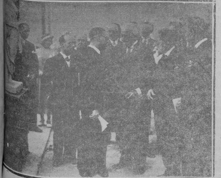
MADRID. — Su Excelencia el Presidente de la República, rodeado por las personalidades, durante la inauguración de la Exposición Nacional de Bellas Artes