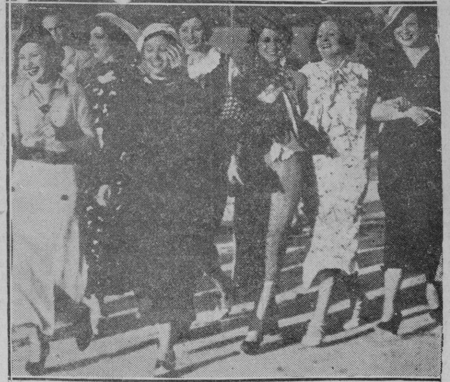
ARANJUEZ. — Las mises durante su visita a Aranjuez

Al lado de este progreso y de esta opulencia hay en España cuatro o cinco mil municipios, cuyo termino municipal íntegro, con sus terras de cultivo y su caserío entero, vale menos que cualquier edificio de la Gran Vía o cualquier palacete de la Castellana. El Estado, por ejemplo, dió su aval por ocho millones de pesetas para construir el llamado Palacio de la Prensa. Con ese dinero, se pudo hacer un pueblo nuevo entero para los vecinos de El Atazar y de la Puebla de la Mujer Muerta y de estas Hurdes madrileñas y de tantas otras como hay en la extensión de España; un pueblo nuevo de casas