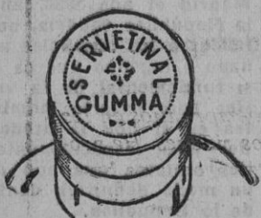
Fig. núm. 1

damos á continuación las características de las dos clases de cápsulas que circulan en el mercado.