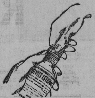
Fig. núm. 4

POR CONSIGUIENTE, TODO FRASCO QUE NO LLEVE LAS CAPSULAS CUYAS CARACTERISTICAS Y GRABADOS INSERTAMOS, SEGUN FIGURAS NUMEROS 1 Y 2 PARA MAYOR CONOCIMIENTO DEL PUBLICO, DEBE SER RECHAZADO, PUES EN ESTE CASO SE TRATARIA DE UNA FALSIFICACION. ASIMISMO RECHACE EL "SERVETINAL" VENDIDO A GRANEL, PUES TAMBIEN ES FALSO