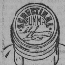
Fig. núm. 2

Esta cápsula es plateada por los dos lados y granate en su parte superior, con una inscripción en relieve formada por el mismo metal de la cápsula que dice "SERVETINAL GUMMA", la palabra SERVETINAL de forma circular y la palabra GUMMA recta debajo de la que dice SERVETINAL. (Véase fig. núm. 1).