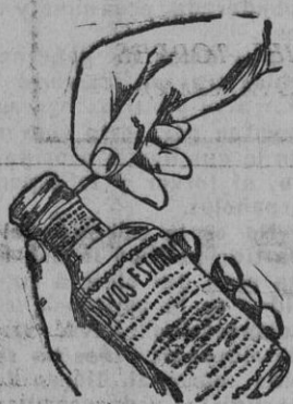
Fig. núm. 3

En su parte lateral adaptada al cuello de la botella se ha practicado un corte con dos puntas, que tirando por cualquiera de ellas quedará la cápsula convertida automáticamente en un tapón de rosca. (Véanse figuras números 3 y 4).