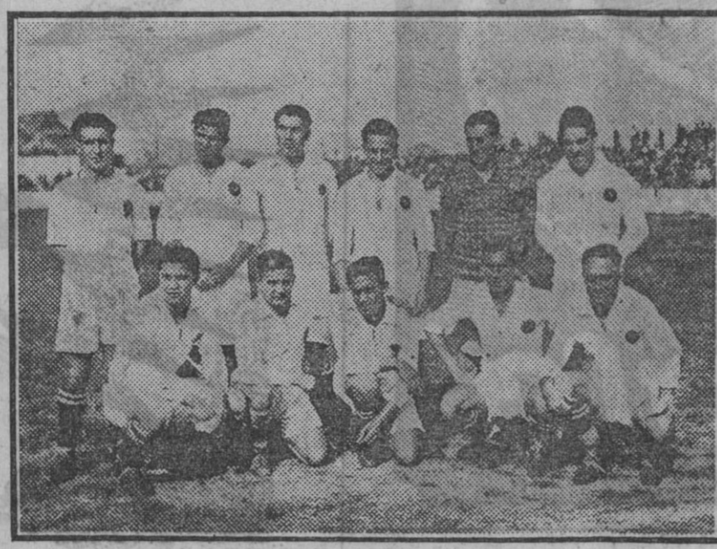
Equipo del Real Madrid