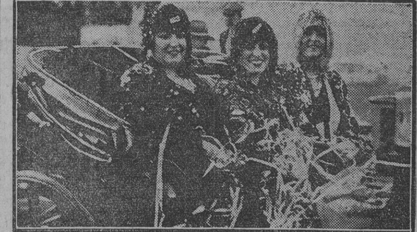
Un carruaje con tres lindas ocupantes.

Tal vez la actuación de la Orquesta Bética de Cámara en la próxima Exposición Ibero-Americana sea el tónico que pueda subsanar la apatía é indiferencia hasta aquí demostradas. FRITZ.