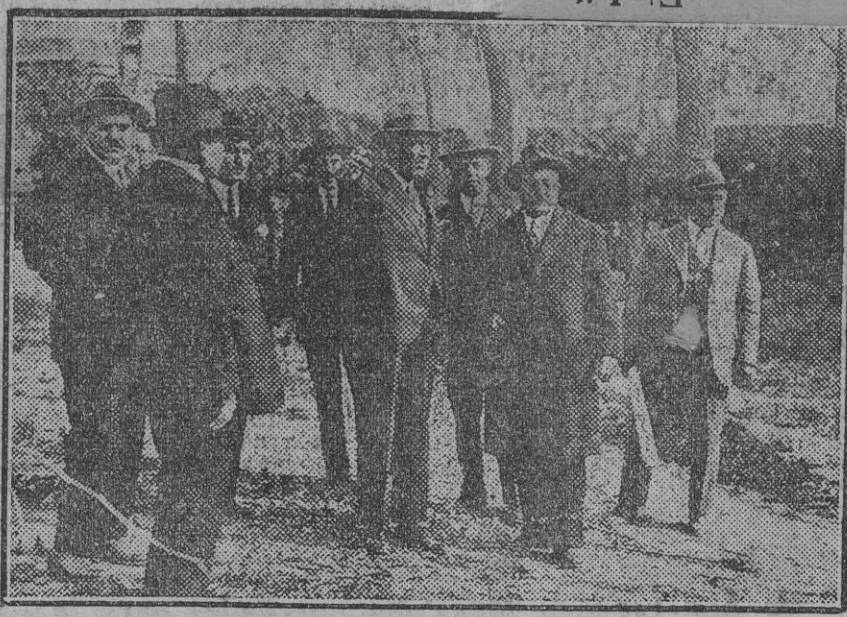
El Alcalde, con los comisionados mejicanos, durante su visita a las obras del pabellón de Méjico.

Explicó el orador detenidamente, con la ayuda de cifras, los gastos de semejante organización y las sumas que podrían ahorrarse reduciendo a términos razonables el número de los Estados y dejando únicamente en pie aquellos que como Baviera, Sajonia y Baden, por ejemplo, acusan realmente verdaderas peculiaridades características diferenciales y robustas tradiciones políticas y administrativas propias; pero borrando después de luego a todos los demás, a fin de que la administración y el funcionamiento de la maquinaria política y económica pueda resultar racional y económica.