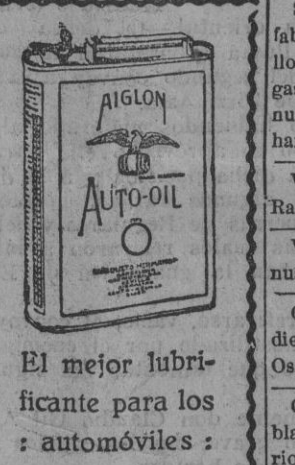
El mejor lubricante para los automóviles

Vendese mesa buró americana.—O'Donnell 28.