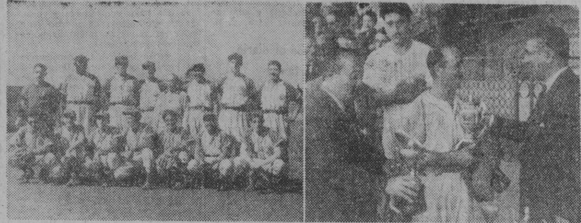
El equipo del R. C. D. Español, que conquistó brillantemente el título de campeón de España. Y momento de ser entregado el trofeo Copa de S. E. el Generalísimo al capitán blanquiazul.