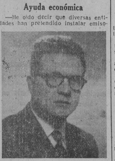
Don Claudio Colomer Marqués, director de Radio Nacional de España en Barcelona