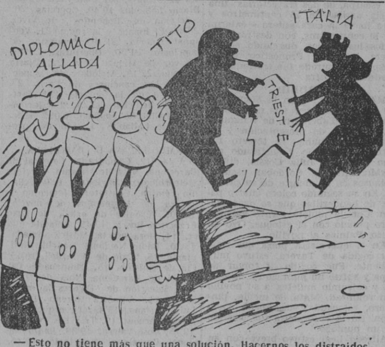
— Esto no tiene más que una solución. Hacernos los distraídos.