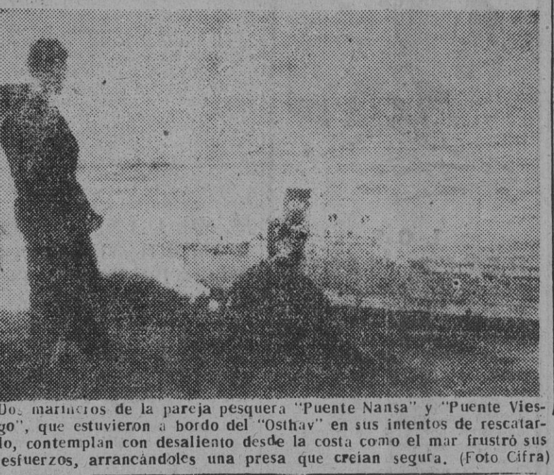
Los marinos de la pareja pesquera "Puente Nansa" y "Puente Viego", que estuvieron en el "Osthav" en sus intentos de rescatarlo, contemplan con desaliento desde la costa como el mar frustró sus esfuerzos, arrancándoles una presa que creían segura.

El petroero noruego "Osthav", partido en dos a causa del temporal