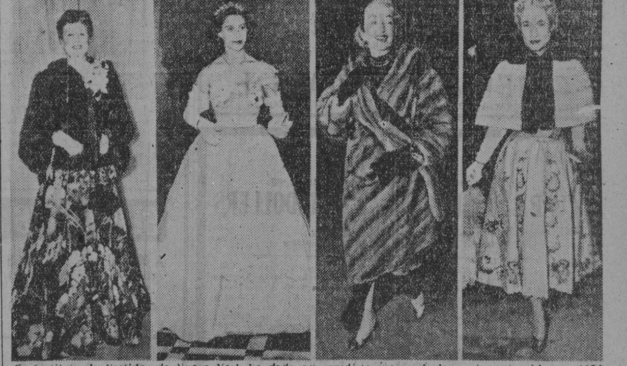
El Instituto de Vestidos de Nueva York ha dado su veredicto acerca de los mejores vestidos en 1951 y de sus poseedoras. Aparecen, de izquierda a derecha: Irene Dunne, la princesa Margarita de Inglaterra y la actriz Marlene Dietrich. La campona es la duquesa de Windsor, última a la derecha.