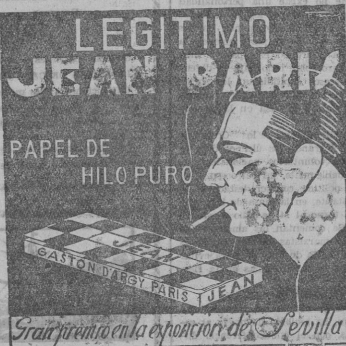
Gran premio en la exposición de Sevilla

Para más detalles, dirigirse al administrador del Bañerario, en el mismo, el que los contestará a correo seguro.