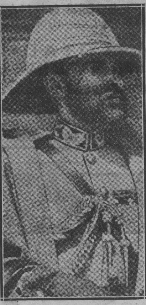
El emperador de Abisinia, Ras Tafari, que ha opuesto una digna actitud a las miras imperialistas y propósitos bélicos de Italia del Duce.