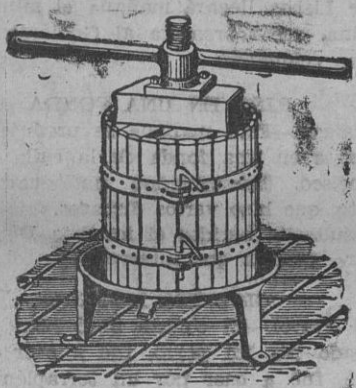
Presas para uva y manzana desde 70 Ptas.

La inscripción se cerrará el martes día 7 quedando suspendida la excursión si para esta fecha no se ha cubierto el autobús.