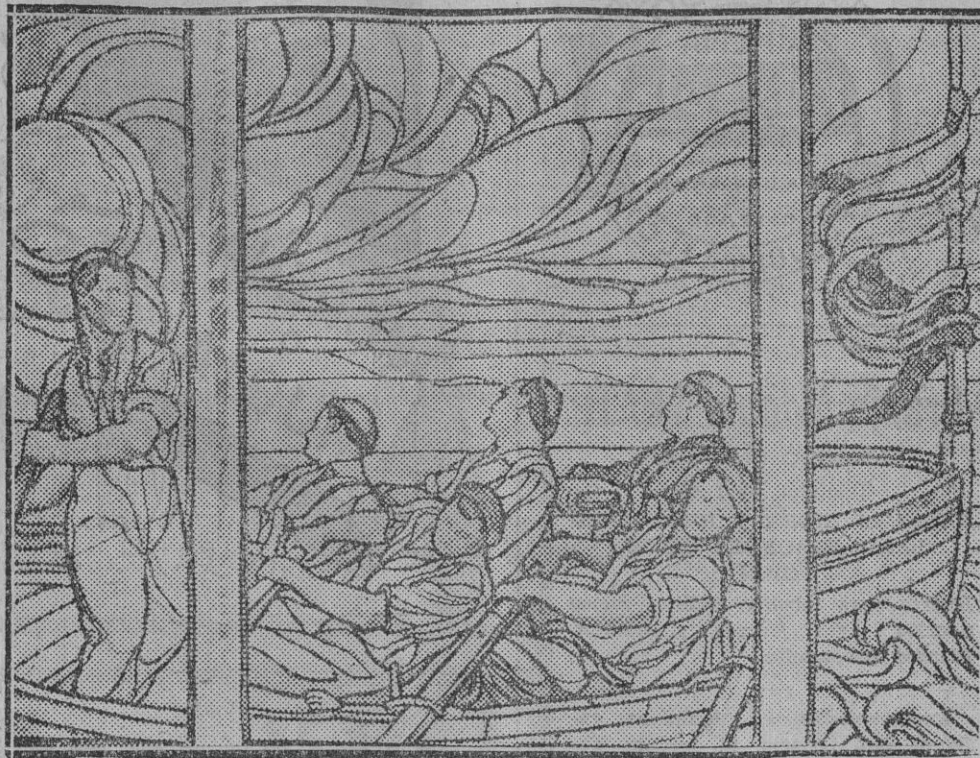
Remeros vascos.--Vidriera de Maumejean

Las lindas niñas, cuyos nombres aparecieron ya en estas columnas, llevaron a cabo con precisión las preciosas zarzuelas, matizadas por graciosas y sentimentales melodías, que con voces de angelical dulzura recreaban los oídos y penetraban hasta el co-