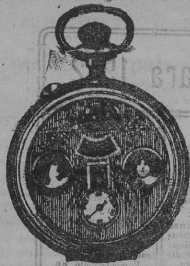
El maravilloso reloj automático