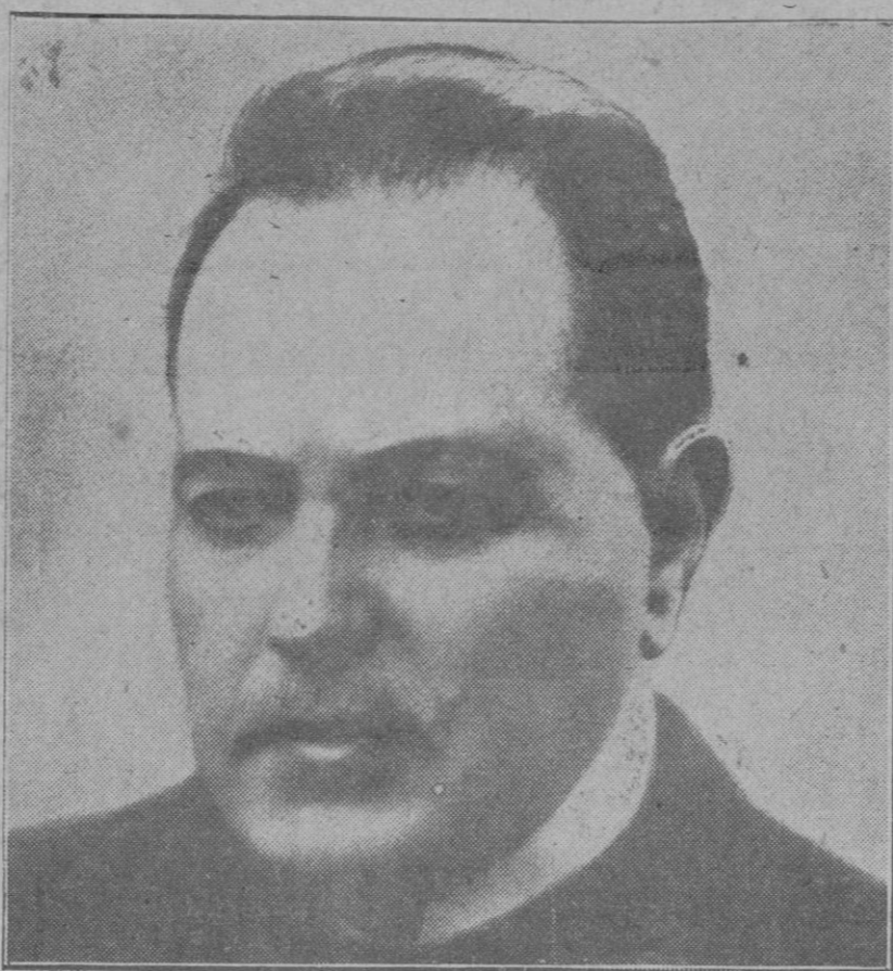
El eminente Doctor don Hipólito Trigoyen, que ha sido elegido Presidente de la República Argentina para el período de 1928 a 1934. El gran estadista ha tomado ya la posesión del cargo.

El departamento de salud pública de la ciudad de Nueva York ha informado que desde 1898 ha habido un aumento de muertes producido por la diabetes de 50 por 100 en los hombres y de 150 por ciento en las mujeres. El promedio de muertes