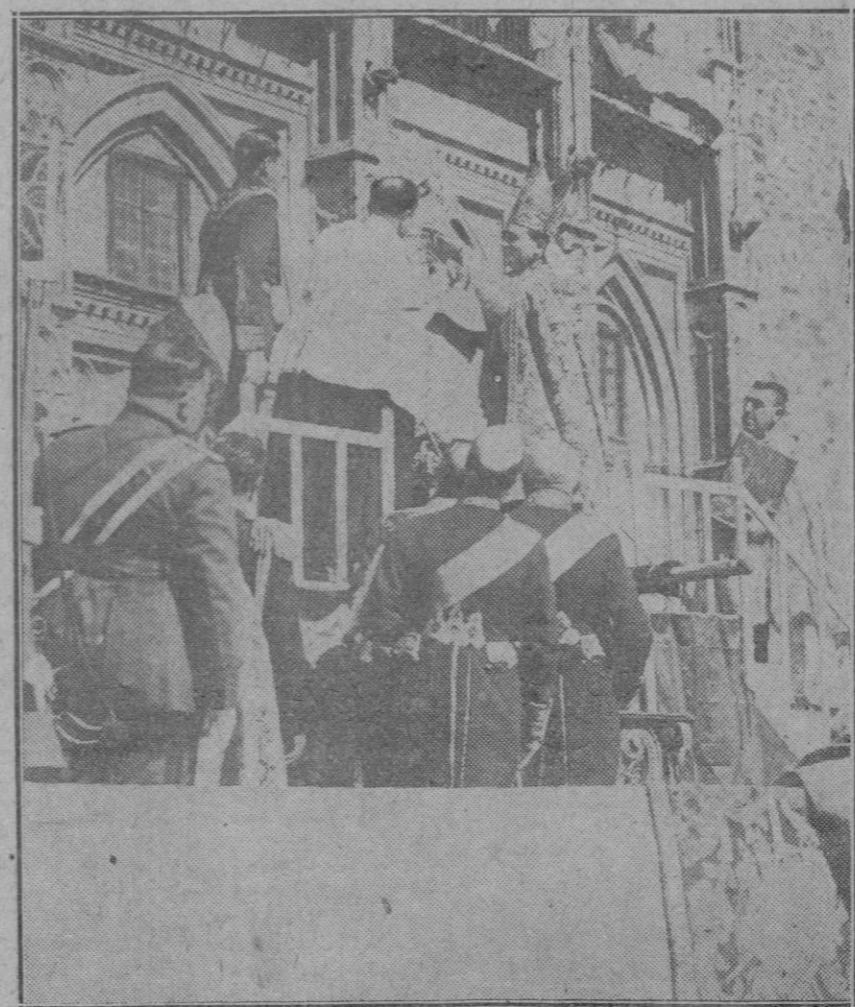
GUADALAJARA (CACERES).—Su Majestad el Rey y el Cardenal Prímado de España, coronando a la Virgen de Guadalupe, cuyo acto ha sido presenciado por el Gobierno, Prelados, autoridades y una inmensa cantidad de público.