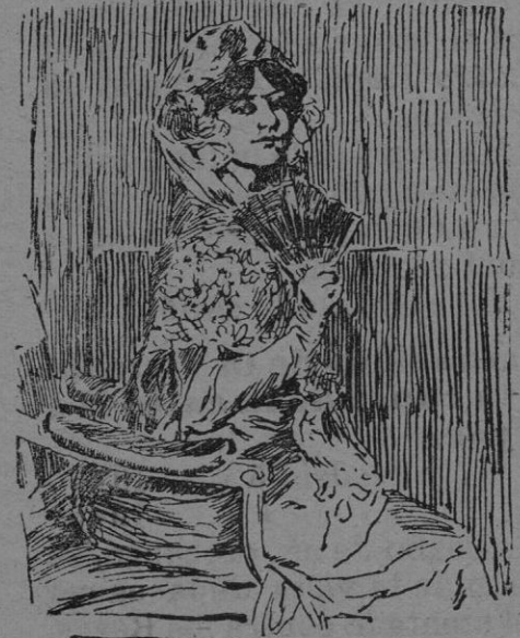
Apunte del cuadro de I. Zuloaga, La del abanico.