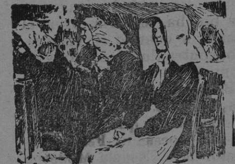
Cuadro En la iglesia, con que se ha presentado á la Exposición el laureado artista Gonzalo Bilbao.