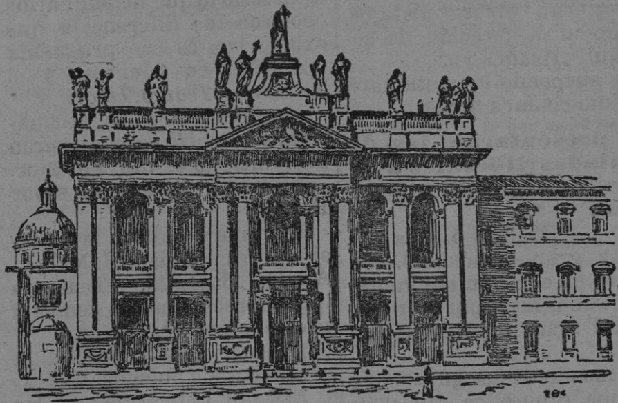
La Iglesia de San Juan de Letrán en Roma á donde muy en breve serán trasladados los restos del Pontífice León XIII