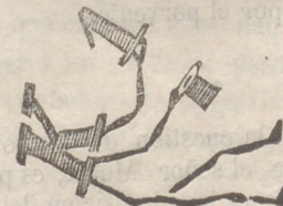
La solucion en el número próximo.