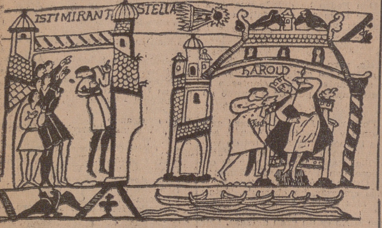
Representación del cometa Haley, en el famoso tapiz de Bayeux, de mediados del siglo XI.

un núcleo rojizo en su centro, como de gases que arden en forma de torbellino; pero a poco la hoguera se apagó, quedando una nube blanca y persistente. Que el estampido debió ser formidable lo prueba el desecarse los colegios, las iglesias y las fábricas, y la salida de muchos vecinos en ropas menores a la calle; haberse desmayado muchas gentes, caer a la calle un albañil desde un tejado, y arrojarse dos sujetos por el balcón, sin causar el menor daño, por caer uno sobre un árbol y el otro sobre un farol del alumbrado.