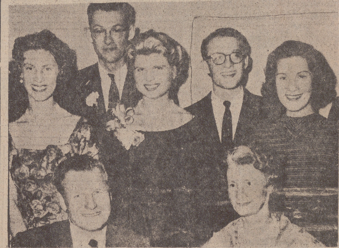
ROCKEFELLER CON SU FAMILIA

MANANA: Capítulo II.—«Paraiso o infierno?—El santuario de las instituciones primitivas.—Una raza misteriosa.—Los famosos cazadores de cabezas».