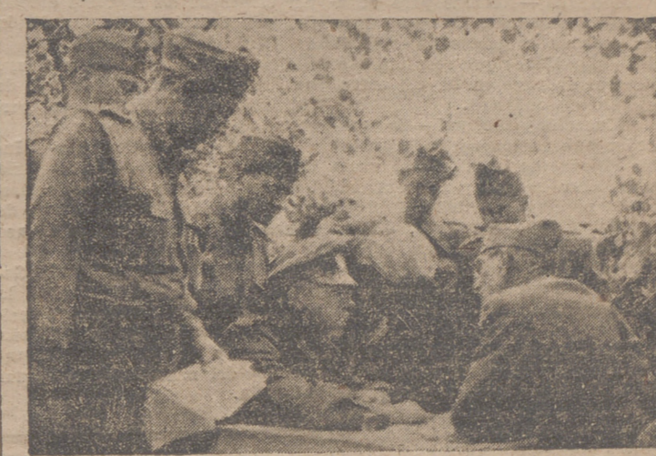
OFICIALES RUMANOS EN UN PUESTO DE MANDO DEL FRENTE SUR RUSO, PLANEANDO LA PROXIMA OPERACION CON UN GENERAL ALEMAN