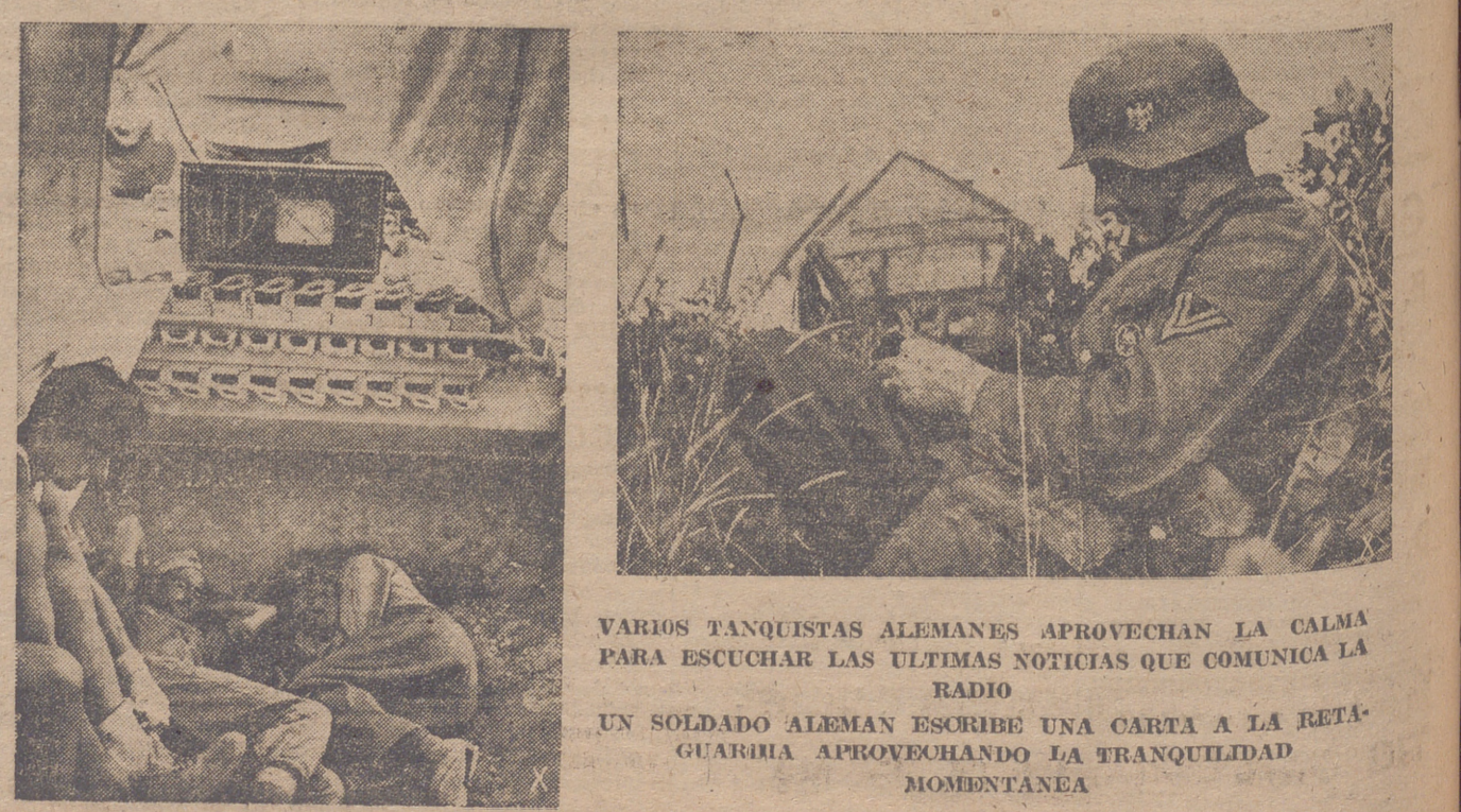
VARIOS TANQUISTAS ALEMANES APROVECHAN LA CALMA PARA ESCUCHAR LAS ULTIMAS NOTICIAS QUE COMUNICA LA RADIO UN SOLDADO ALEMAN ESCRIBE UNA CARTA A LA RETAGUARDIA APROVECHANDO LA TRANQUILIDAD MOMENTANEA