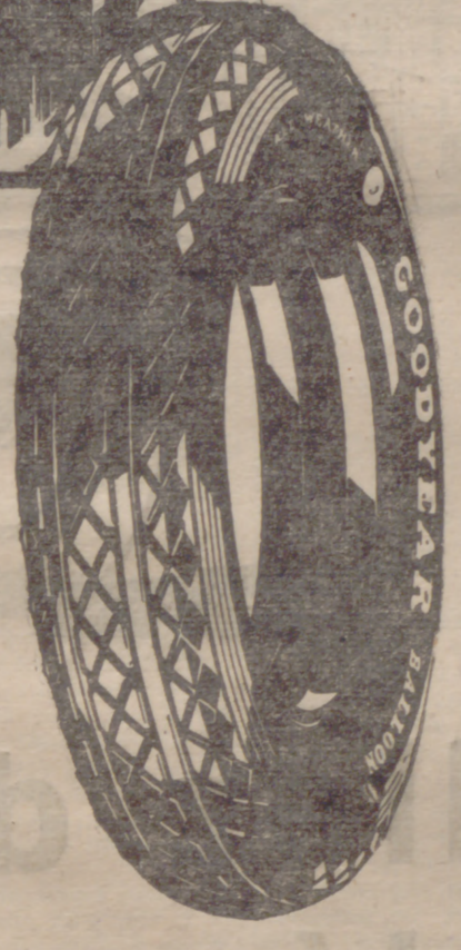
Monte Goodyear para visitar las Exposiciones

Para todos los neumáticos Goodyear hay una cámara Goodyear de igual resistencia y calidad.