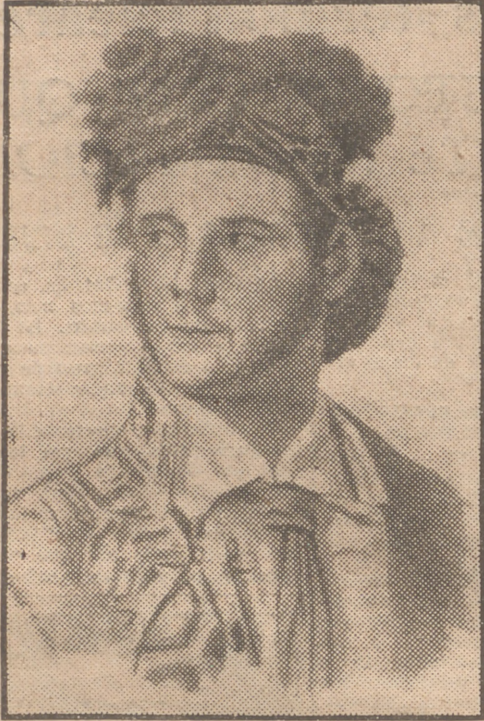
FRANCISCO MONTES (PAQUIRO)

Isabel II quiso darle un título nobiliario