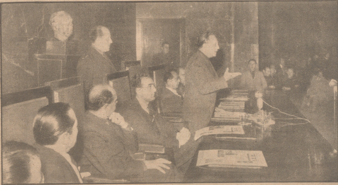
Recogemos aquí el acto de clausura del I Consejo Político Sindical, en el momento en que pronuncia su discurso el ministro secretario general del Movimiento, cuyo texto integro publicamos en la página cuarta, y a quien acompañan en la presidencia los ministros de Educación Nacional y de Información y Turismo, el vicesecretario general del Movimiento, el Delegado Nacional de Sindicatos y otras jerarquías.

WASHINGTON, 17.—La Comisión de Energía Atómica ha publicado un comunicado cuyo texto oficial es el siguiente: “La fuerza operativa conjunta número 132, operando para el Departamento de Defensa y la Comisión de Energía Atómica de los Estados Unidos, ha concluido el tercer ensayo de la serie de desarrollo de armas en el atolón de Eniwetok, en las islas Marshall. Como las series Greenhouse, en 1951, ese ensayo está des- tinado al ulterior desarrollo de varios tipos de armas. En cumplimiento ulterior del anuncio del Presidente, hecho el 31 de enero de 1950, de que el programa de ensayos incluía experimentos, contribuyendo a la investigación de armas termonucleares.” Los dirigentes científicos de los ensayos han expresado satisfacción por los resultados. Los jefes y miembros militares y civiles componentes de la fuerza (Pasa a la página 5.)