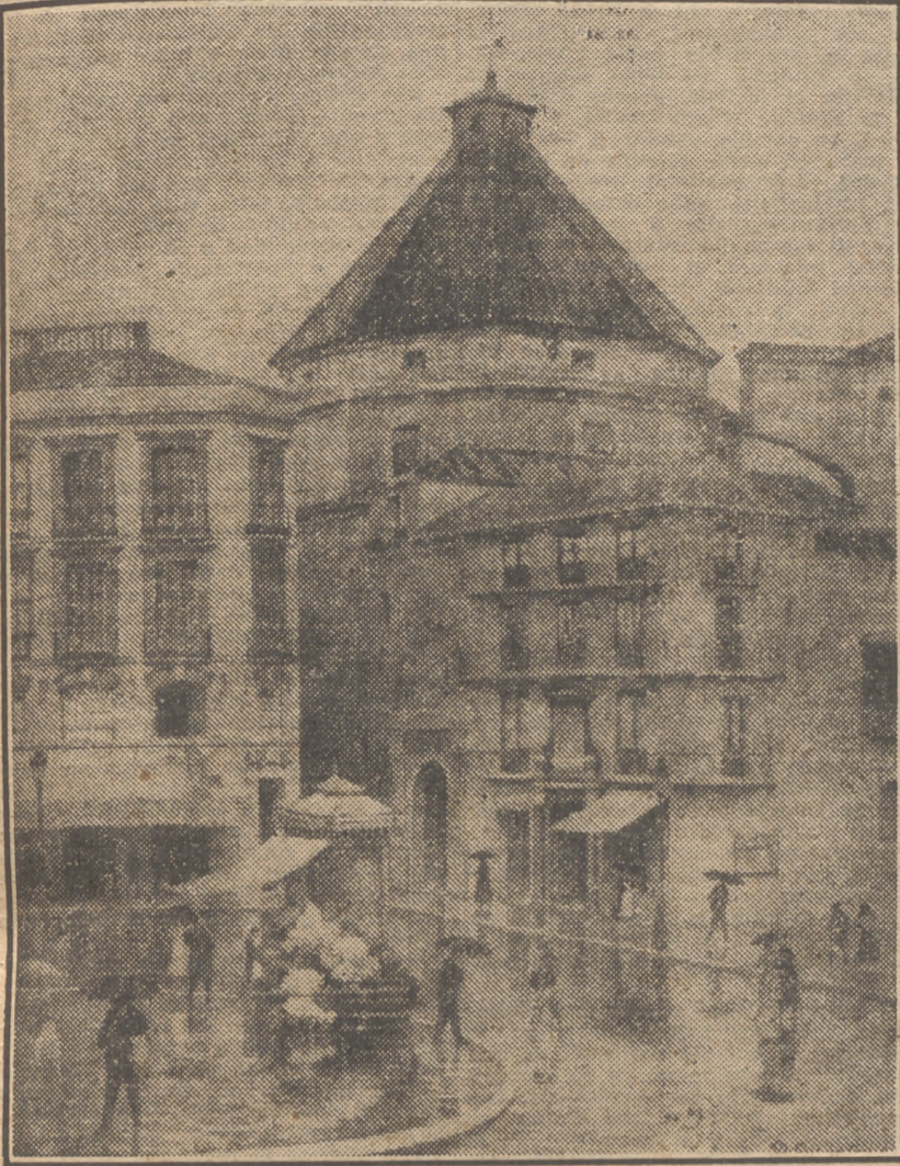
"El bello rincón de la plaza", acuarela de Diego García Carreras, que figura en la Exposición malagueña.