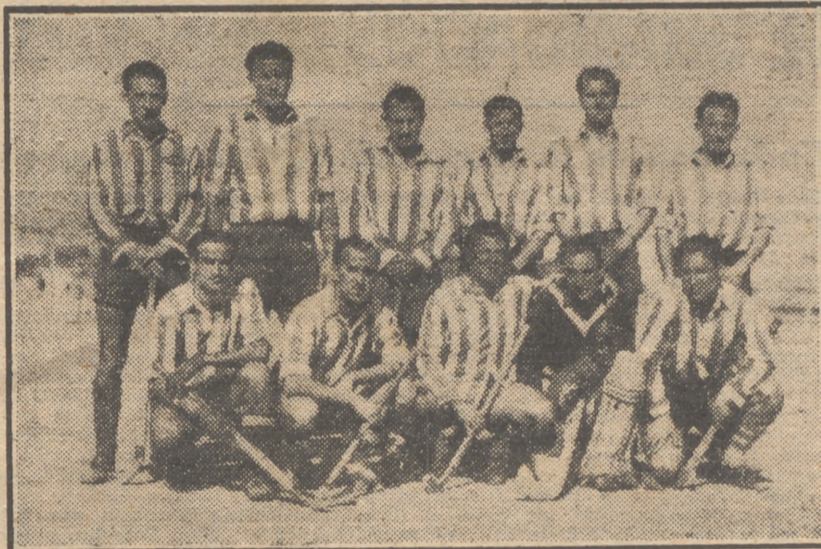
El equipo de hockey del Atlético Aviación que, después de sus últimas victorias sobre su "eterno rival" el Club de Campo y el grupo de Chamberí, se ha clasificado campeón regional.

dos o entrenados sean descalificados automáticamente y algunos puntos reglamentarios que pasarán a estudio de la Comisión nombrada al efecto. En nombre del Club de Gracia, el mismo Comité presentó el que para la categoría de veteranos bastarán los treinta y cinco años, proposición que no fue aceptada.