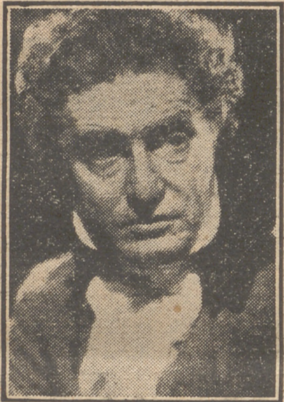
Robert Donat, el formidable actor, protagonista del inolvidable film de gran éxito "Adiós, Mr. Chips", reaparecerá muy pronto como intérprete de la gran superproducción de la 20th Century Fox "El vencedor de Napoleón".