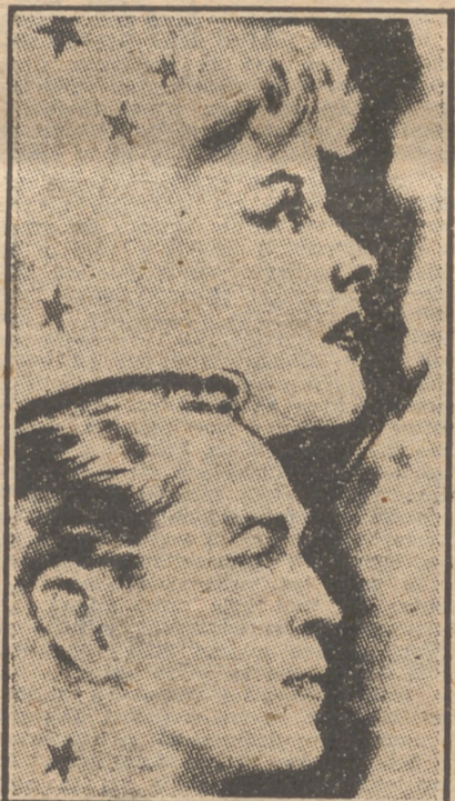
Katherine Hepburn y Franchot Tone, juntos por primera vez en el film "Quality Street", el mayor éxito del cine americano, que en breve se estrenará en Madrid, presentado por Edici.