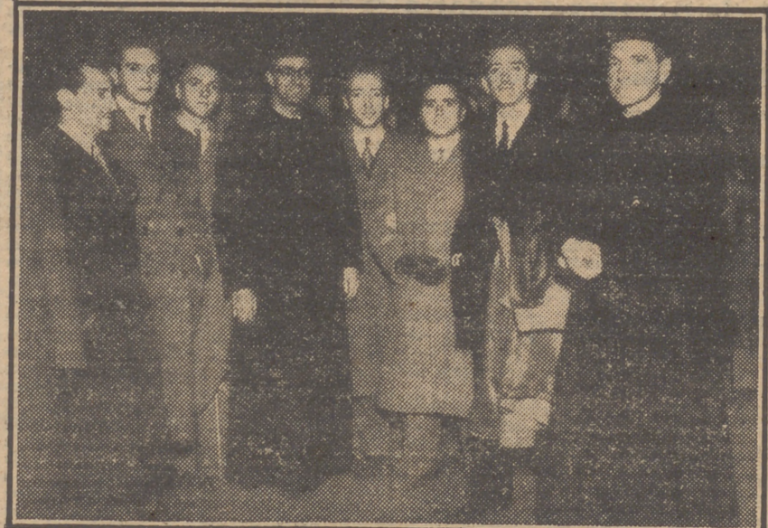
Llegada a la estación de Mediodía de la peregrinación española que asistió al nombramiento de los nuevos cardenales en Roma.