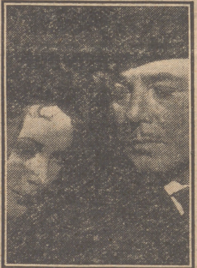
Hedy Lamarr y George Brent, pareja central de la extraordinaria producción R. K. O. Radio "Noche en el alma", de próximo estreno en Madrid.

"Noche en el alma", de éxito internacional, tiene un solo marco: el Coliseum, el cine de moda.