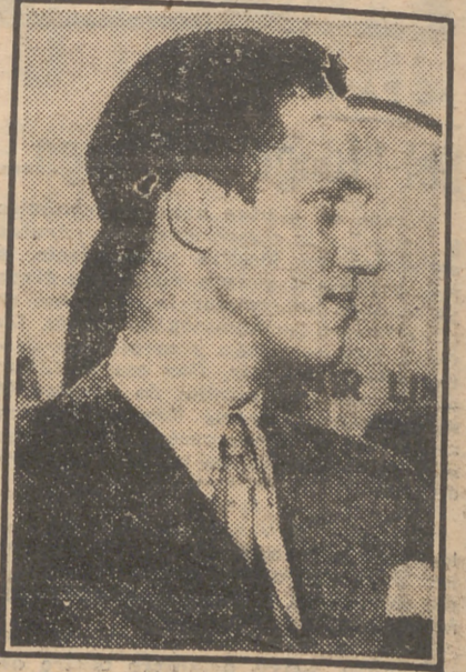
Según un periódico sueco, el príncipe George de Dinamarca, que tiene veinticinco años de edad, será el marido de la princesa Isabell de Inglaterra. La noticia, al parecer, no ha sido desmentida todavía.