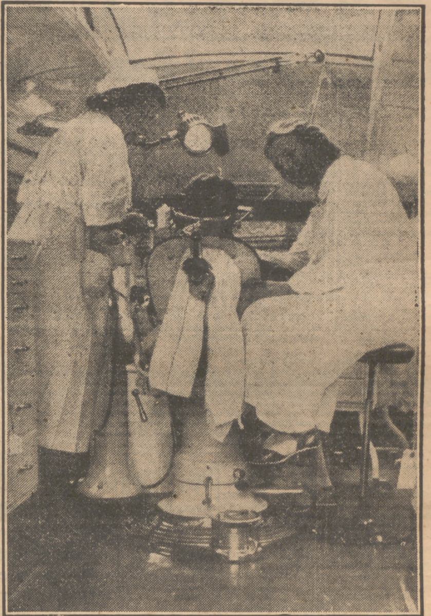
La mujer invade los campos que hasta ayer estaban reservados al hombre. No cabe duda que cuando ellas se lo proponen trabajan a la perfección. He aquí dos dentistas durante la dolorosa—si es sin inyección—tarea de extraer huesos de la boca de un paciente. La compañía de las dos odontólogas será muy grata; sus sonrisas, optimistas y alentadoras; pero ¿la extracción? Las mujeres suelen ser amables y suaves cuando no están enfadadas; sin embargo, no sabemos cómo se comportarán cuando extraigan muelas a un inveterado solterón. (Foto A.)