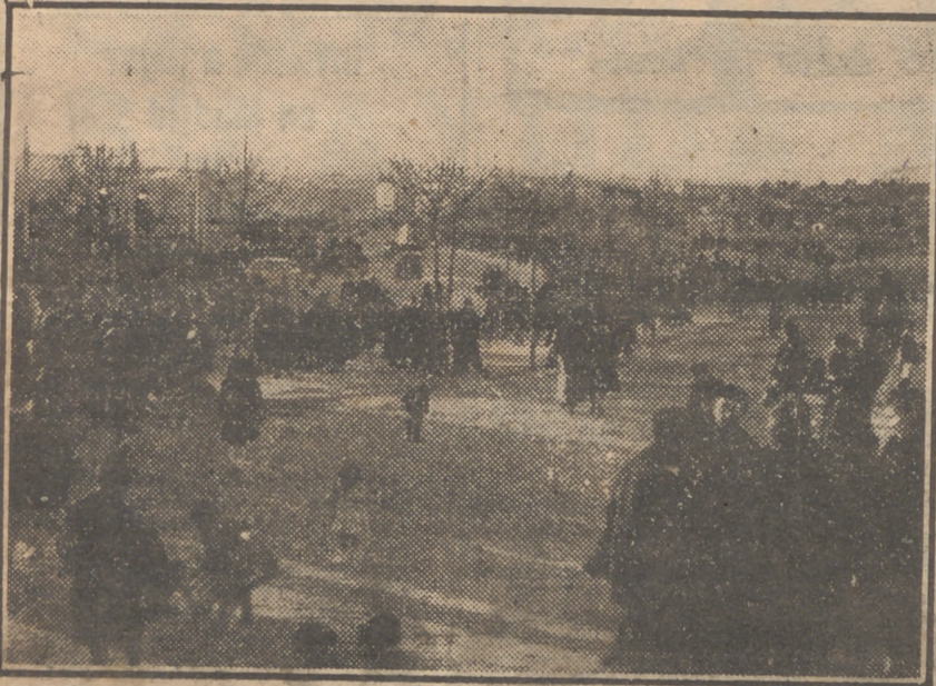
Es de justicia reconocer que Madrid posee hoy alrededores luminosos y espléndidos que el pueblo invade en días de fiesta para solazarse y respirar el aire puro de la Sierra. He aquí el aspecto de la Moncloa en la tarde del último domingo.