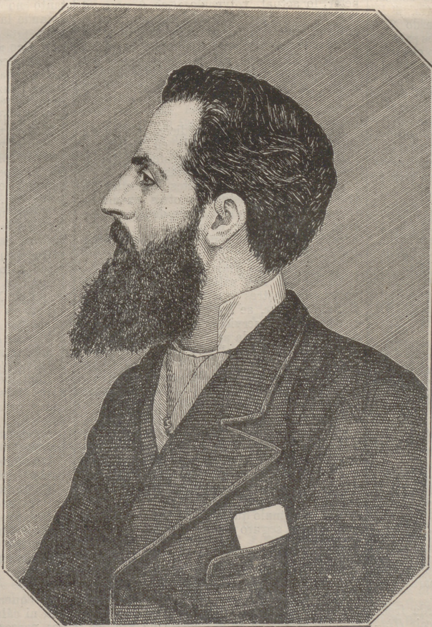
D. ALEJANDRO PIDAL Y MON, DEFENSOR DE LA UNIDAD-CATÓLICA EN ESPAÑA.

Me parece que á mi cocinero le pasa lo que á muchos hombres que son políticos, y á otros muchos que