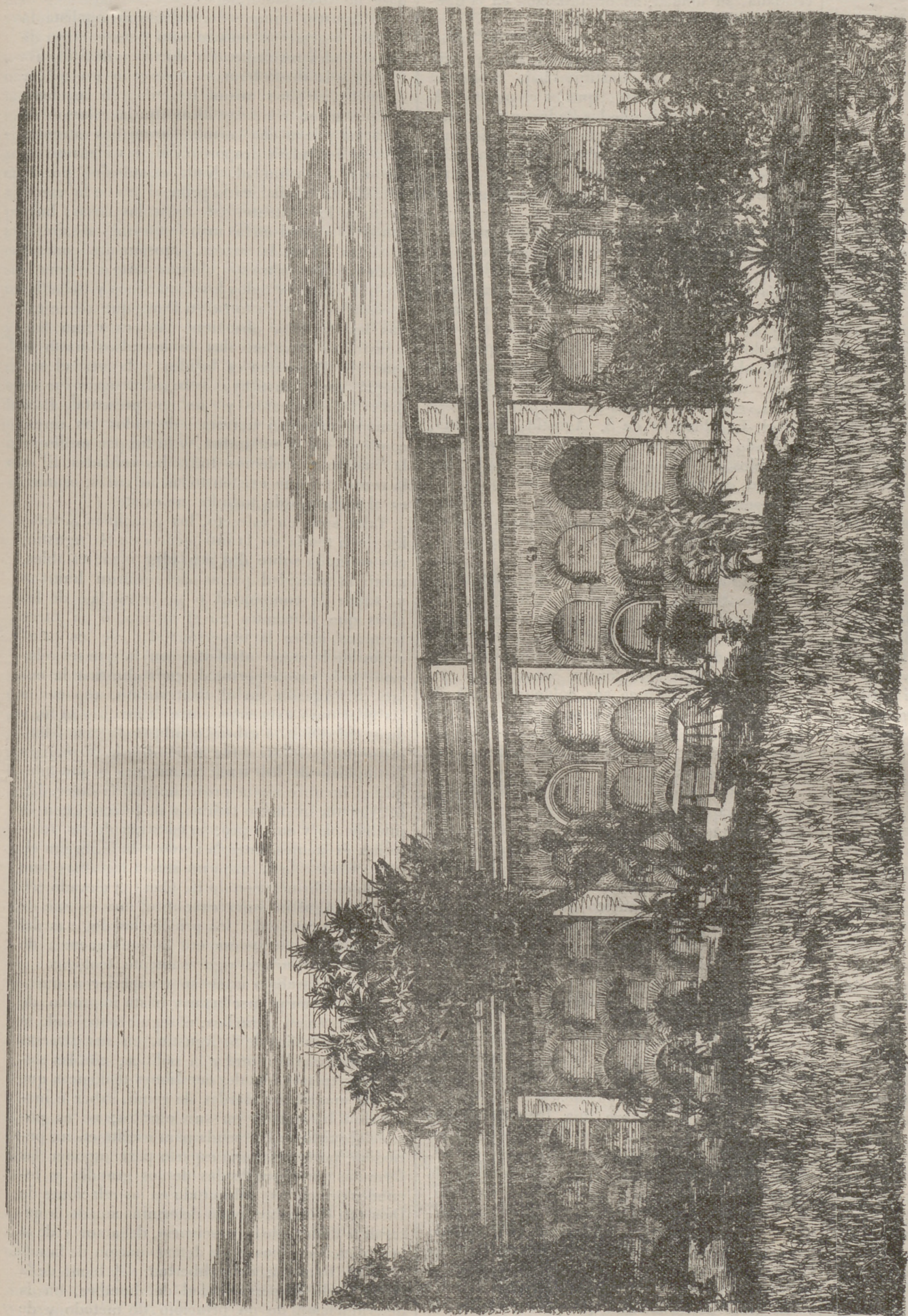
CEMENTERIO GENERAL DE PACO: VISTA DE UNA DE LAS NAVES INTERIORES.

llevarán todos los del mundo al mar en un solo año? Imposible es calcularlo: pero se sabe que las lagunas de Venecia se van cegando de año en año, que Rávena edificada á orillas del mar dista hoy de él, tres leguas: que en tiempo de Trajano se edificó una torre en la orilla del Tiber y hoy dista de ella dos mil doscientos metros: que el golfo de Smirna será cerrado en breve por el Ermo: y que Roseta y Damietta edificadas frente á Alejandría, á la orilla del mar, se encuentran hoy á dos leguas de distancia de él.