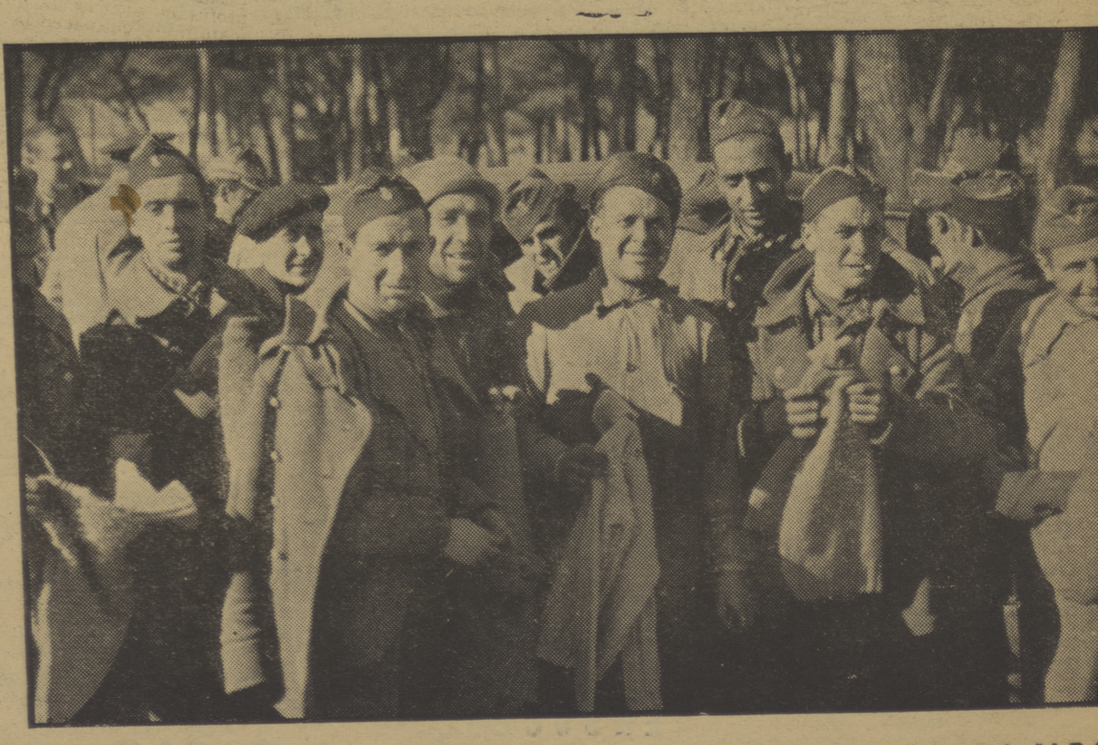
Los milicianos rojos que luchan en Madrid reciben prendas de abrigo distribuidas por el Socorro Rojo del P. O. U. M. entre los contingentes obreros que combaten heroicamente contra las huestes mercenarias del fascismo internacional.