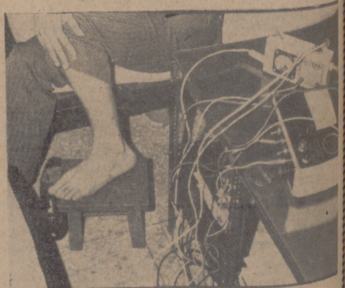
Esas agujas en la pierna curarán a este paciente de su reumatismo.

Tras los postres, la nostalgia se desata en mis anfitriones que comienzan a recordar los años pasados en España, los lugares visitados, los amigos, uno de ellos, tal vez bajo el efecto del licor de arroz mencionado con un buen conaoc español, me sorprende con algo tan sencillo en boca de un chino como un fandanguillo de Huasteca.