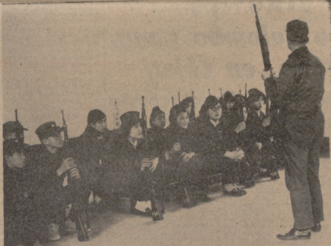
Operarios de una fábrica aprenden el manejo del fusil.

Cuenta la leyenda que fue un agricultor el primer beneficiario de esta técnica terapéutica. El hombre padecía de grandes dolores en una de sus piernas y caminaba con dificultad por la falda de una montaña cuando tropezó y sufrió en la pierna herida el pinchazo de una aguja de arista de roca que se le quedó incrustada en ella. Poco después, el dolor desapareció para siempre. En efecto, las primeras agujas que se utilizaron en las curaciones eran de piedra, de ello da fe el libro «Shan-Hai-Ching», en el que se puede leer: «En las montañas de Tung-