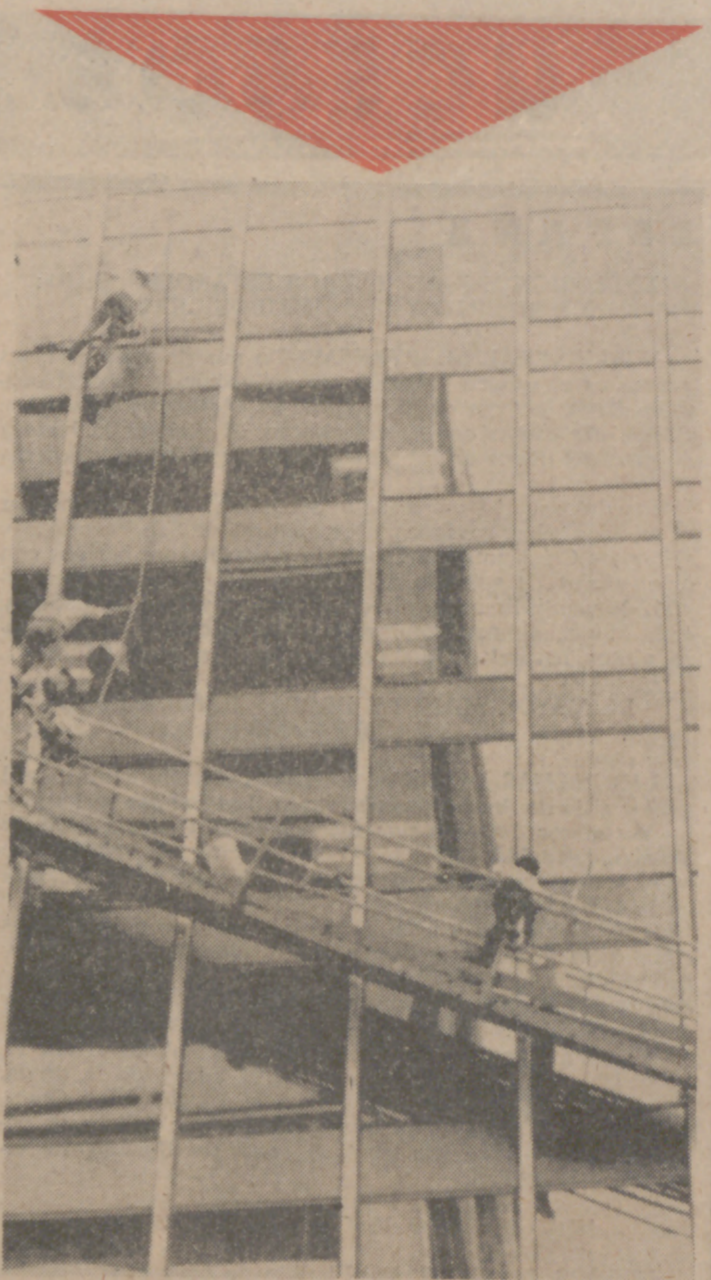
HOUSTON.—Un limpiaventanas es puesto a salvo en tanto que otro se aferra al andamio que se desprendió. Un bombero tuvo que ser bajado al andamio (izquierda) para asegurar con correas a los dos obreros, al objeto de poderlos izar y ponerlos a salvo. Los obreros resultaron ilesos, pero pasaron veinte minutos de ansiedad sobre la plataforma, inclinada peligrosamente a gran altura.