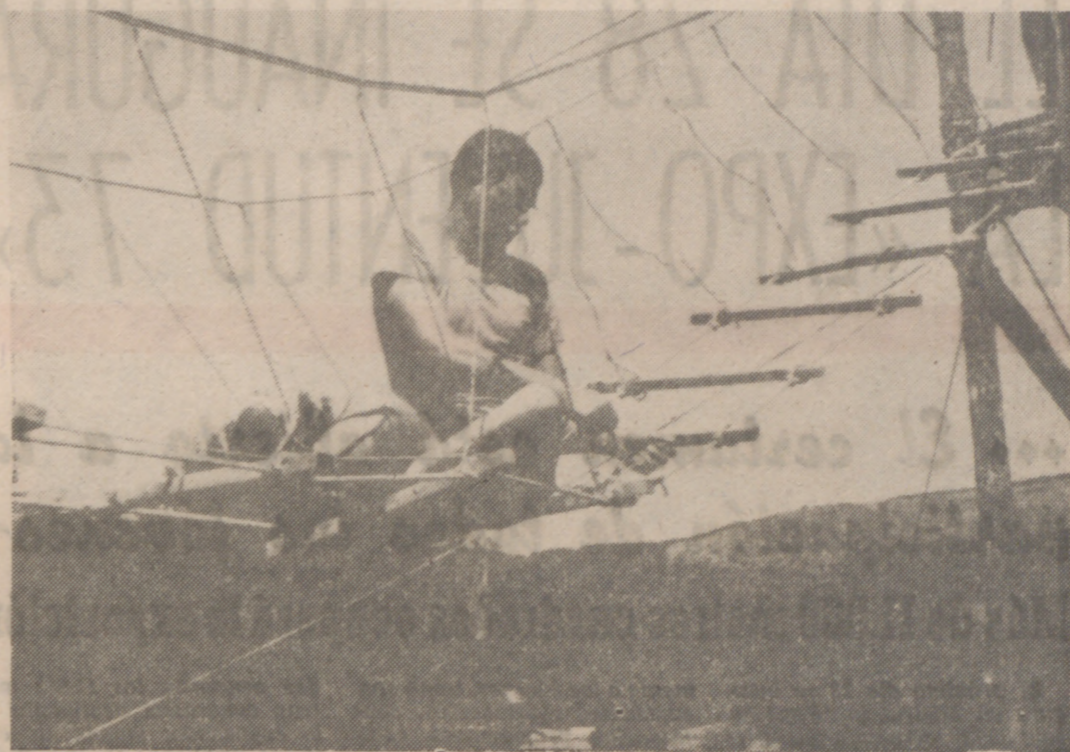
Atar cabos, tender puentes, entre el pasado y el porvenir de España.