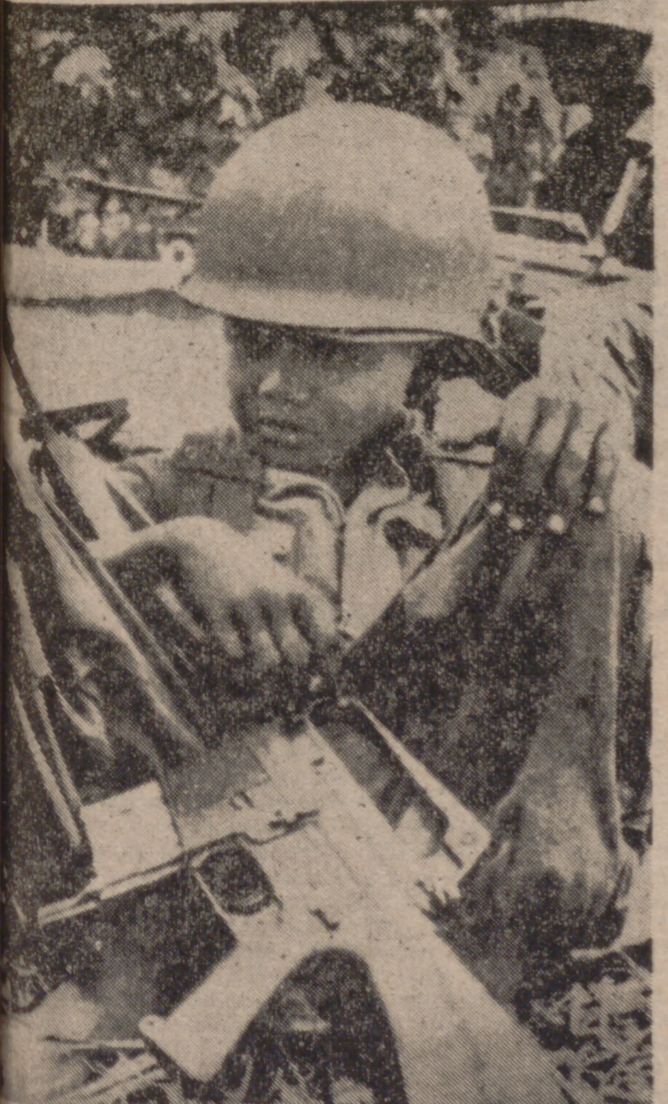
PHNOM PENH (Camboya).—Un soldado gubernamental, casi un niño, con su uniforme, que le está grande, casco y fusil metralizador, se toma un descanso durante los combates a lo largo de la carretera número 5.

NUEVA YORK, 26. (Del correspondiente de PYRESA, Félix Ortega).—Oficialmente no hay nuevo Yalta. Fuentes cercanas a la Presidencia norteamericana insisten en que no hay acuerdo secreto derivado de la «cumbre» Nixon-Breznev cuyo fin último sea sustituir la actual situación bipolar mundial por otra de preponderancia de los antiguos enemigos de la guerra fría. Pero tanto fuentes europeas occidentales como chinas están claramente preocupadas por lo que de cara al futuro del mundo pueda significar el cambio radical de relaciones USA-URSS.