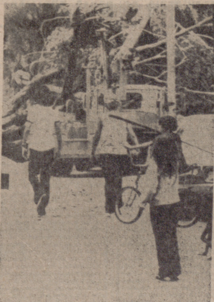
CORAL CABLES.—Algunos residentes en esta zona residencial de Florida contemplan cómo los equipos de la empresa eléctrica «Florida Power & Light Company» reparan los daños causados por un tornado, que derribó árboles y postes. El fenómeno y un accidente ocurrido a una grúa ocasionaron el mayor apagón registrado en el Estado.

PARIS, 26. (Efe).—La entrevista «cumbre» franco-soviética ha dado comienzo esta mañana, en el Castillo de Rambouillet, a las 10,45 (hora española). El Presidente de la República Francesa, Georges Pompidou, que salió esta mañana, a las diez, del Palacio del Eliseo, llegó a las 10,25 al Castillo de Rambouillet, donde fue recibido por el primer secretario del partido comunista de la URSS, Leonidas Breznev. El dirigente soviético, que se acostó esta madrugada a las 3,30, después de un largo viaje desde Estados Unidos, se levantó cinco horas después, desayunando a las 8,30 en el comedor del Castillo. Después de haber intercambiado un fuerte apretón de manos y unas palabras de cortesía, Georges Pompidou y Leonidas Breznev se dirigieron al «boudoir» Marie-Antoniette, dando comienzo la primera de las tres entrevistas inscritas en el programa de la visita a Francia del líder soviético.