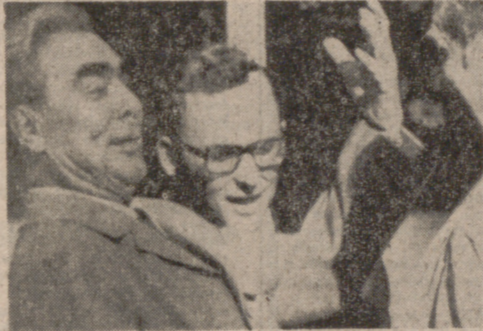
SAN CLEMENTE (California).—El dirigente soviético Leonid Breznev (izquierda), gestiona en tanto responde a una pregunta que le formula el actor cómico Red Skelton durante una recepción ofrecida por el Presidente Nixon en la Casa Blanca occidental de San Clemente, a la que asistieron numerosas personalidades de Hollywood.

Aislamiento chino.—Incremento comercial Moscú-Washington.— Preponderancia rusa en Europa.