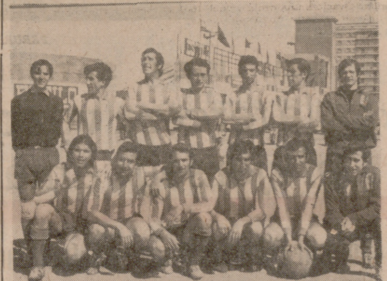
El At. Fasa, que ante la Ferroviaria perdió muchas posibilidades.