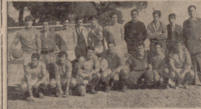
Formación del Azor, vencedor de la Antigua.