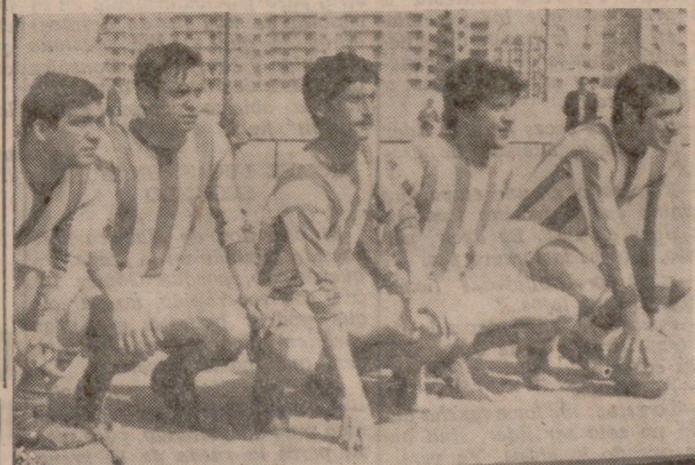
DELANTERA DEL BETIS