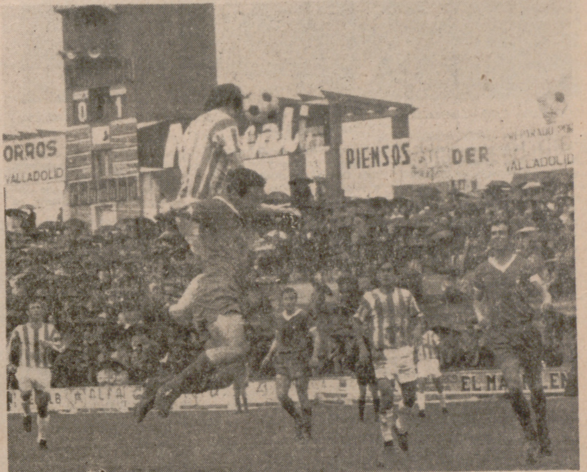
OTRO REMATE DE ALVAREZ.—Alvarez, además de marcar el gol, fue el más pródigo en los remates. Aquí le vemos conectando un cabezo, superando con mucho en el salto a su antagonista.

creemos, es sortear como se pueda este bache y salvar la permanencia. Este es, dicho con crudeza, el panorama. No hay para más... aunque se haya da- do sensación en algunas lorna- das de no desmerecer ante los mejores. Posiblemente, tal im- presión podría haber prospera- do hasta el final contando con otros factores coadyuvantes. Pe- ro de eso, por aquí, no se da. La mayoría, una gran mayoría de los aficionados, está ahora con el temor en el cuerpo, por- que son conscientes de que existe peligro; pero —y esto sí es lamentable— hay algunos sectores que parecen disfrutar con ello, porque otra conclu- sión no cabe después de com- probar que es precisamente en estas situaciones cuando más exteriorizan sus opiniones, cuan- do más rebullen. Que sepamos, ninguno de ellos se ha distin- guido en los elogios en las jor- nadas de fiesta, que, no lo va- mos a negar ahora, también se han producido. El objetivo, aho- ra, es el entrenador; pero, ¿es de verdad enemiga contra Hé- ctor Martín? No lo creemos. Es contra el entrenador, sí, pero