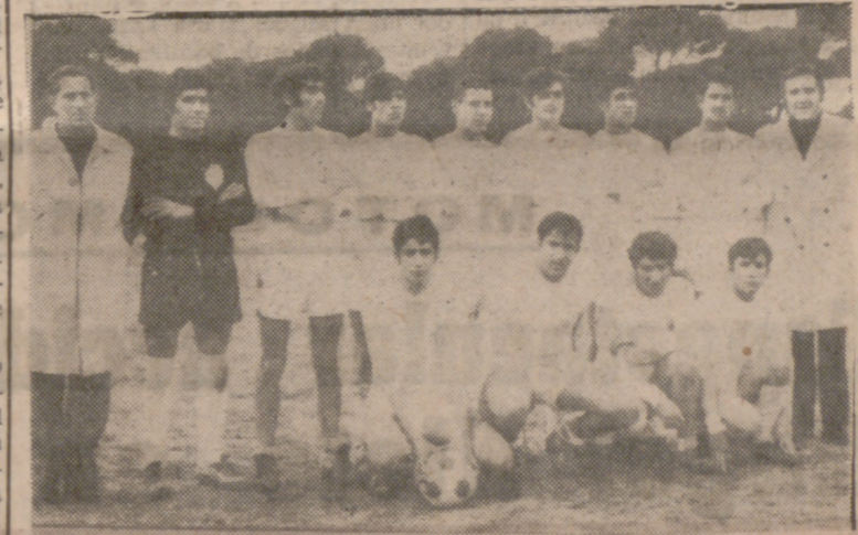
La Flecha, que se repartió los puntos con La Góndola.

Por último el Juventud Fasa —que atraviesa un excelente momento de juego— dio buena cuenta del San Nicolás a quien batió con holgura, encarrilando ya favorable-