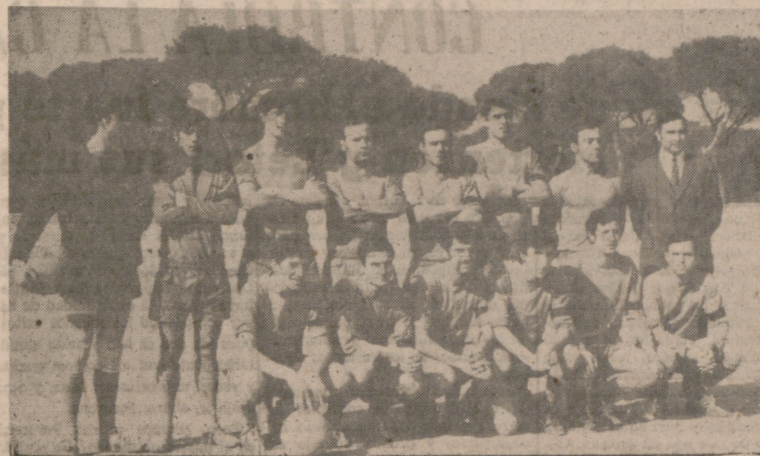
Aunque pudo tropezar ante el colista, el Vivero sigue mandando en su grupo.

Indudablemente, el encuentro cumbre de la jornada en Segunda Categoría era el que enfrentaba al Racing Valladolid y al JAR, primero y segundo, respectivamente, en la tabla del grupo segundo, pero emparejados a puntos ambos.