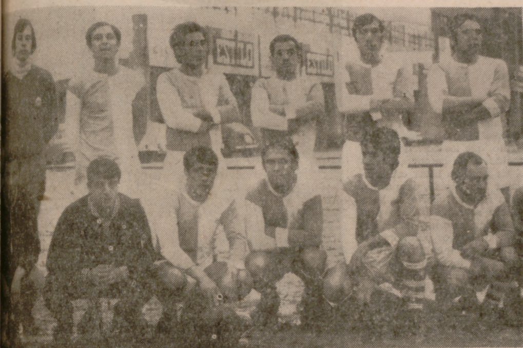
EL CIRCULAR SOLO PUDO EMPATAR CON EL BETIS