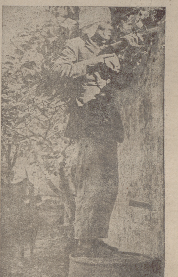
He aquí una estampa cotidiana de Argelia. Alerta contra posibles ataques, un indigena, enrolado en las milicias, vigila dispuesto a repeler cualquier agresión.

SON muchos los que leyendo las noticias referentes a los disturbios primero en Marruecos, luego en Túnez y ahora en Argelia se preguntan qué diferencia puede haber entre los conflictos planteados por los partidarios de Ben Arafa y Ben Yusef, por un lado; los «fellaghas», por otro, y, por último, los nacionalistas argelinos. ¿Es que acaso todo no es colonia o protectorado francés?, se dice el lector que está un tanto confuso con estas informaciones procedentes del Africa del Norte francesa—por no llamarla Marruecos, puesto que, como veremos, no es así—.