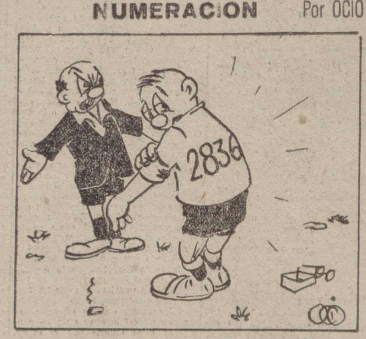
—Todo lo lógico que usted quiera, pero... ¿y los que no tengan teléfono, qué?