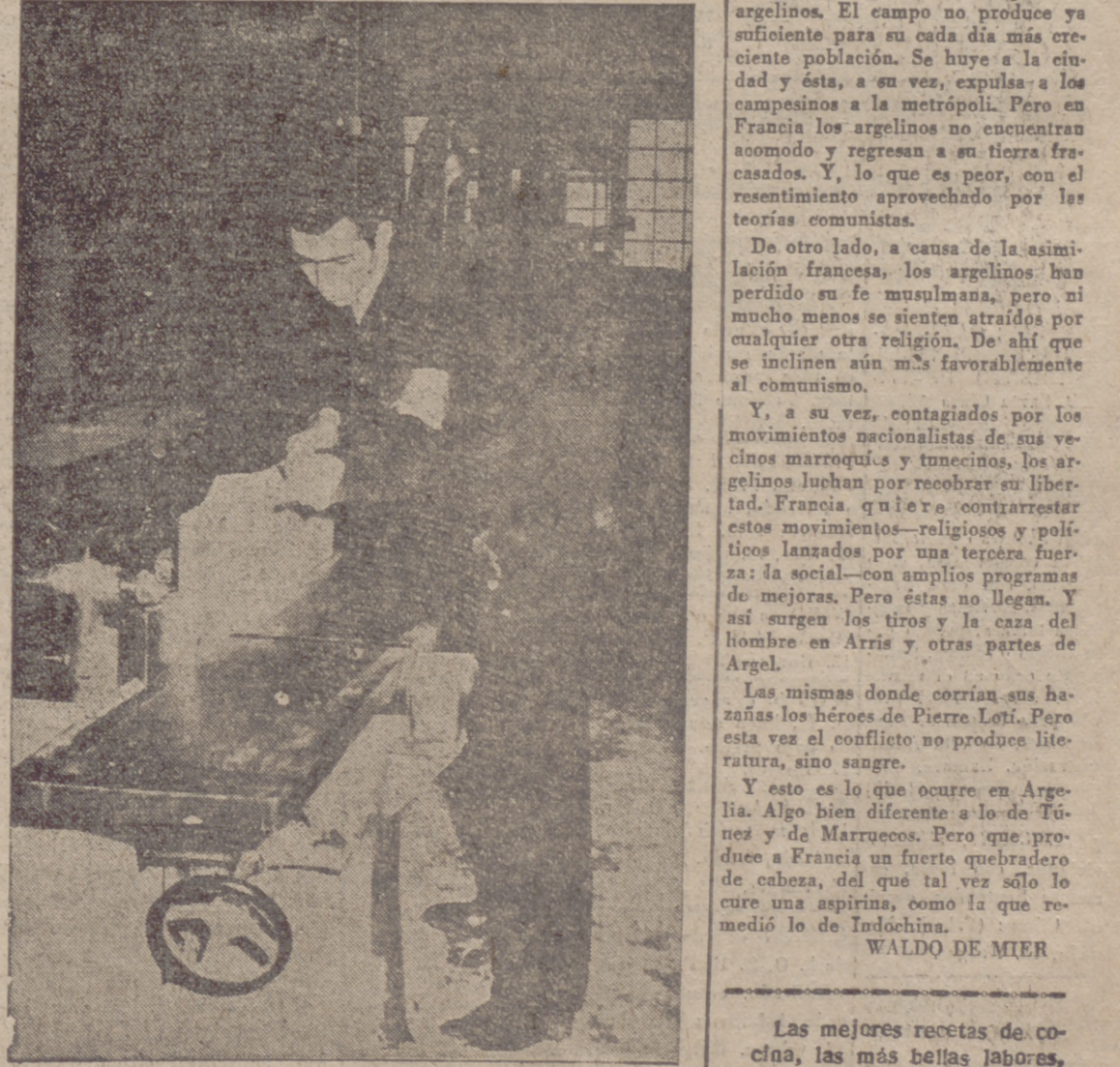
MADRID.—En el Colegio de la Virgen de la Paloma, de Sindicatos, se ha inaugurado la prueba final del Concurso Nacional de Aprendices, en el que toman parte cerca de trescientos que representan a las distintas provincias de toda España.

Católica MUJERES MIGUEL cuatro y estudios en bre. Se sup... ción Católica OCEANO la misa que lo los días 25 p las Familias de la misa que en lugar de la asistencia ad CION -Tel. 25-44 RACION -Tel. 23-71 diernos, 26 ENTO TECNOLOR UEGU OBA DANTE accuio la dinámica