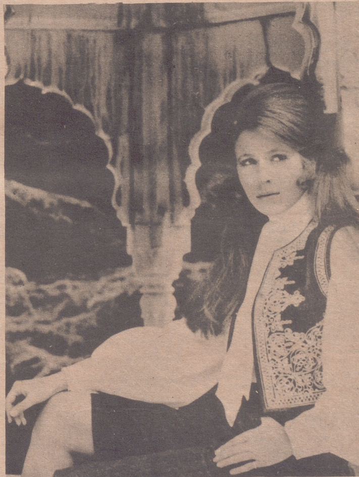
WINDSOR, (Inglaterra).— La Princesa Ana, que celebró su 21 cumpleaños posa en esta foto especial para dicha fecha, ante un cenador indio de mármol en los campos de Frogmore House, Windsor. Lleva un bolero bordado y pantalones de cacho en tela denim (algodón) de azul marino y una blusa de cuello alto y mangas largas y amplias, con corbata en el cuello.