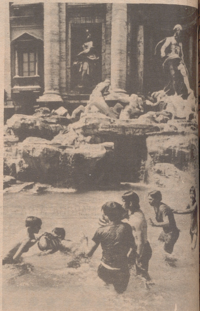
ROMA.— Un grupo de jóvenes romanos están "pescando" monedas que los turistas tiran en la fuente de Trevi. Dos jueces han dictado el jueves que no es ilegal el coger las monedas.