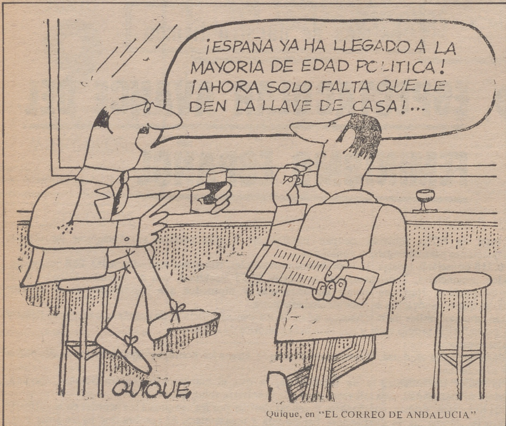
Quique, en "EL CORREO DE ANDALUCIA"