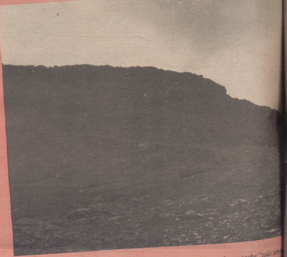
Un paseo recomendable para todo aquel que disponga de un coche "todo terreno".

Es cierto que lo fundamental de un pueblo es la cultura potenciando los valores del pueblo, de la gente, no la instrucción barata que puede ser añadida como un simple barniz y que desarrolla parcialmente a la persona. Pero es necesario conocer el pensamiento, el desarrollo y la cultura de otros pueblos y de otra gente. Es preciso intercambiar con esos hombres que han sabido realizar una síntesis entre los libros y la vida concreta. Hace falta, por lo menos, dialogar de vez en cuando, con gente nueva para enriquecer y contrastar las propias ideas. Es vital recibir una educación básica y tener un mínimo de posibilidades para ir autoeducándose en el contacto con otros hábitos y otras vidas.