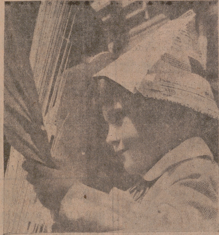
La procesión de "La Borriquilla" en Valladolid resultó brillantísima. En la foto, un niño, con su palma en la mano, se defiende del fuerte sol primaveral con un gorrito hecho de papel de periódico.

Roma.—S. S. Juan XXIII, en un discurso pronunciado con motivo del Domingo de Ramos, se ha referido a las "víctimas de la opresión moral y física tras el telón de acero" y a la "Iglesia del Silencio", por las que ha expresado su profunda preocupación. El Pontífice recordó las palabras de los evangelistas, según las cuales "los enemigos de Cristo son los autores de todo el mal que exista en el mundo". "Este recuerdo se dirige especialmente a los pueblos de muchas partes del mundo que habiendo sido destinados a disfrutar de los beneficios de la paz y del progreso, son, por el con-