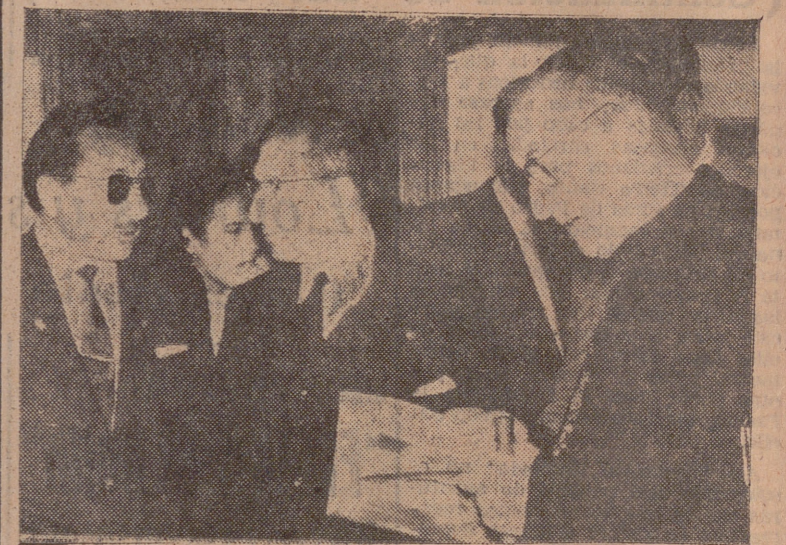
El Arzobispo y el Capitán General, visitando la exposicion de fotografias.

Gran expectacion ha despertado la exposicion fotografica de los hermanos Carvajal, en colaboracion con Informacion y Tur-