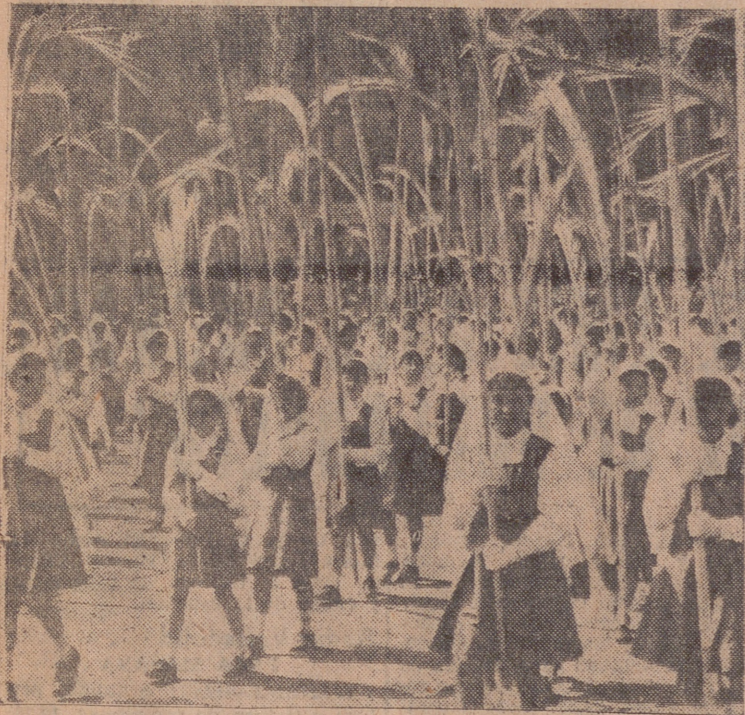
Las niñas, con palmas, en la procesion.

Resultó muy brillante la de la "Borriguilla" El Arzobispo bendijo a los niños en la iglesia de la Vera Cruz