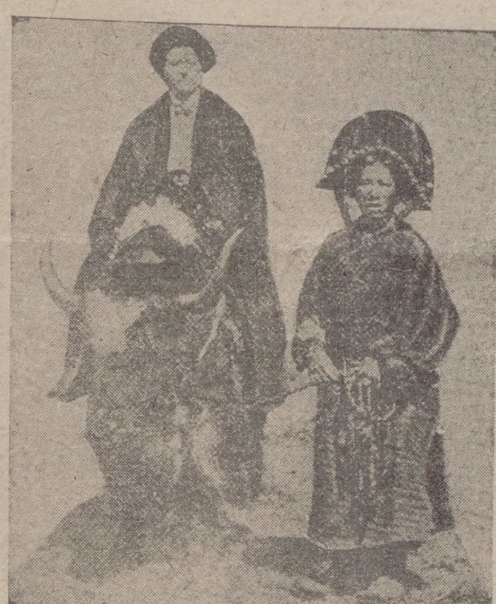
En el «Techo del Mundo», la montura más normal es el buey. Como los caminos son intrincados, es preciso valerse de los servicios de un buen guía, desempeñados en este caso por la señora tan originalmente tocada.

En nuestro último número recogimos una noticia lechada en Londres sobre la invasión del Tibet por el ejército comunista chino. Sea o no confirmada, el «Techo del mundo» es hoy, junto con Formosa, el país más amenazado. A este respecto, Radio Pekín no se anda con eufemismos. A principios de este año decía: «Los próximos objetivos del ejército popular son Formosa, Hainan y el Tibet». Con objeto de que nuestros lectores tengan conocimiento pleno de la situación, les ofrecemos este reportaje sobre el país de las lamas.