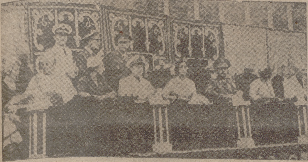
Acompañado de su esposa, ministro de Justicia, delegado Nacional del Frente de Juventudes y otras personalidades, Franco preside el acto de inauguración de un Estadio del Frente de Juventudes, en el sitio denominado «Caño de Ancoeta».