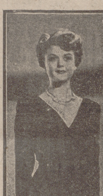
En estos concursos, pudimos apreciar que el acatamiento del público no era fervoroso ni unánime.

Por azar, he leído estos días en periódicos extranjeros noticias de un concurso de bellezas. Ignoro detalles de la organización de estos actos, y supongo que será complicada y curiosa, pero sé que siempre hay en cada país un periódico que los anuncia y propaga con una publicidad que si bien va gastando sus recursos con la repetición, no deja de tener una eficacia tentadora. Quizá sin ella sería imposible la selección sobre bases tan amplias, ya que la natural reserva femenina, sin el acuciente estímulo de los anuncios y el amplio conocimiento de la sucesiva decisión de otras competidoras, produciría un retraimiento perjudicial para los fines de los organizadores, que supongo que no serán simplemente estéticos, sino con miras a un negocio, porque no parece fácil admitir que los muchos gastos de desplazamientos costosos, toaletas de lujo y demás imprescindibles requisitos sean románticamente pagados por un hombre o una Sociedad acometidos del raro capricho de saber si es en el Canadá o en Bulgaria donde existe la muchacha más atrayente.