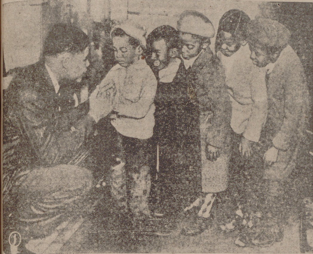
Joe Louis con un grupo de negritos del barrio negro de Nueva York.

Intenta sacar a puñetazos los 200.000 dólares que debe al Tesoro norteamericano