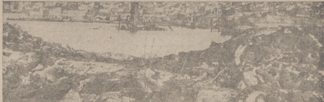
Destrucción de instalaciones y buques británicos en el puerto del Pirro