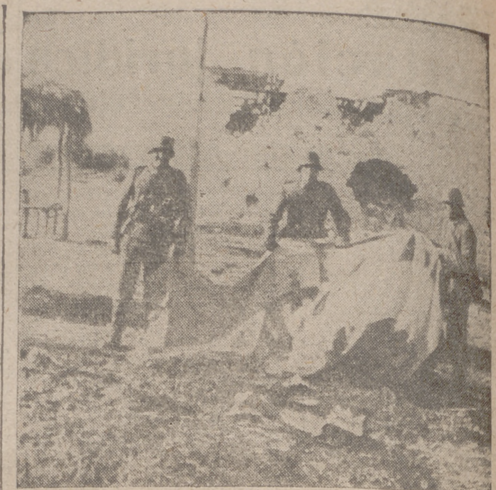
Soldados alemanes con una bandera del Ejército griego, que lograron capturar en la reciente campaña.

"Unidades de nuestra aviación han atacado las bases enemigas de la isla de Malta durante la pasada noche. En Sollum las fuerzas italianas han capturado prisioneros y se han apoderado de nuevos cañones y siete carros blindados en una operación que ha conducido a la ocupación de una importante posición defendida por el enemigo. El pasado día 26 las unidades de nuestra aviación han atacado a unas cien millas de Derna a una formación naval enemiga. Un portaaviones, un crucero, un destructor y cuatro barcos mercantes fueron alcanzados por las bombas arrojadas por nuestros aparatos. En otro crucero, alcanzado por una bomba de grueso calibre, se observó una fuerte explosión. Otros aviones italianos han bombardeado el puerto de Tobruk y los barcos surtos en él mismo. En África oriental han sido rechazados los ataques enemigos en el sector Norte de Galla-Sidamo. En el sector de los lagos, el coronel Cicco ha hallado gloriosa muerte a la cabeza de sus tropas durante los combates de estos últimos días. En Hhambara, los italianos ocupantes de la localidad de Chief, que se encuentra cercada por el enemigo, han rechazado los ofrecimientos británicos de capitulación.—Efe.