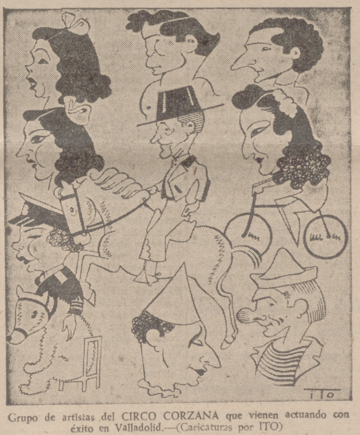
Grupo de artistas del CIRCO CORZANA que vienen actuando con éxito en Valladolid.—(Caricaturas por ITO)