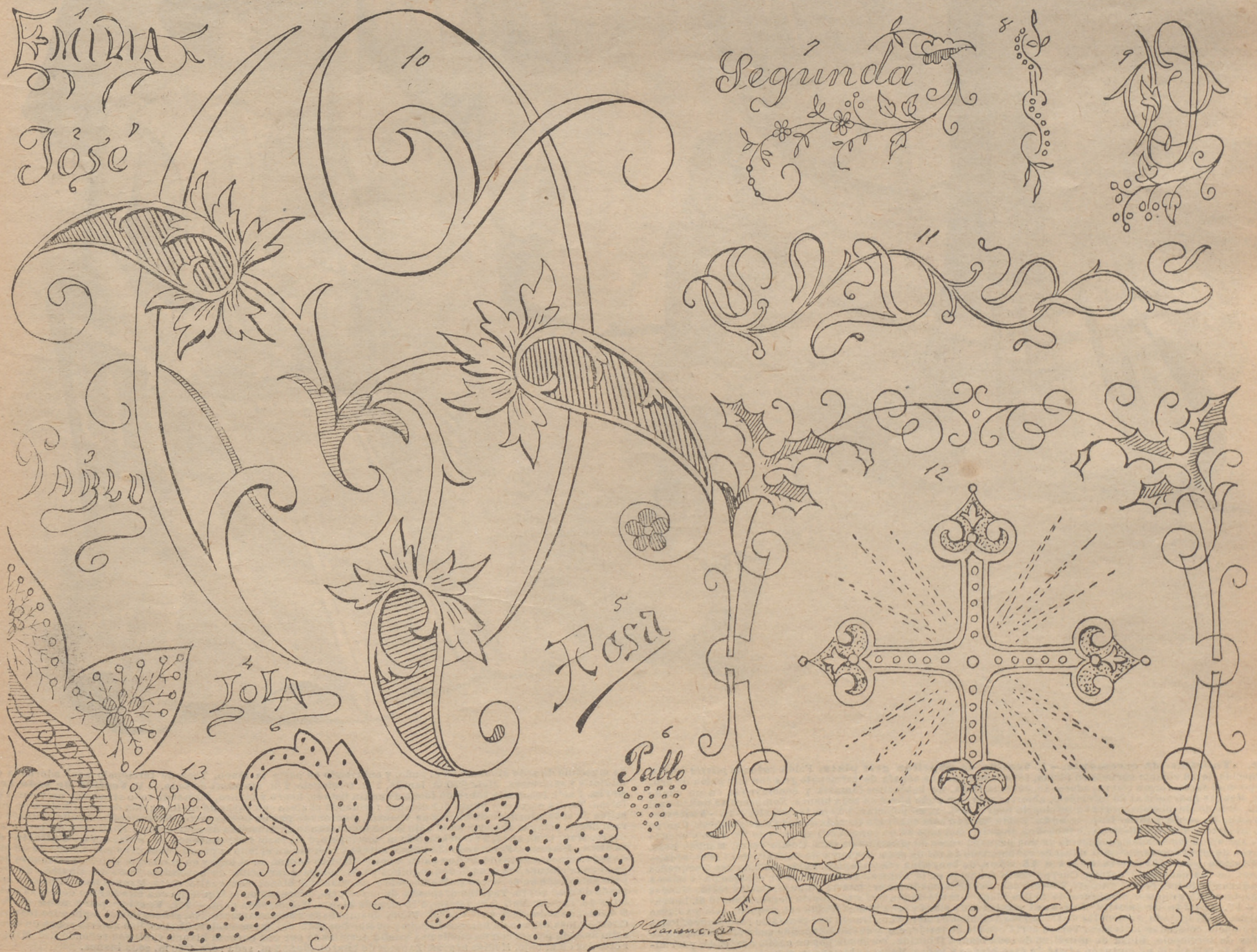
2. 1, 2, 3, 4, 5, 6, 7 y 9. Enlaces y nombres para pañuelos. — 8. Entredós para lencería. — 10. Continuation del abecedario. — 11. Dibujo para ligas. — 12. Dibujo para palla. — 13. Mitad de dibujo para caja guantes.

La llave que se usa no se toma. Muchos granos de trigo hacen un montón. Galgo que muchas liebres levanta, ninguna mata. Mientras el necio piensa, hace el discreto la hacienda. No hay camino tan llano, que no tenga algún barranco. La diligencia es madre de la buena ventura. Más vale tienda cara, que despensa barata. Toma casa con hogar, y mujer que sepa hilar. Gobierna tu boca según tu bolsa. Labrador de capa negra poco medra. Mira qué ates, para que desates. No hay cosa tan mala, que para algo no sirva. Planta muchas veces traspuesta, ni crece ni medra. No se queje del engaño, quien por la muestra compra el paño. Gota á gota, la mar se apoca. No hay quien haga la hacienda, como su dueño. La casa envinada, medio empenada. Pocas veces escardar, pocas espigas al segar. Guarda de mozo y hallarás de viejo. La boca y la bolsa, cerradas. Más vale que me deba un pobre, que deber yo á un rico. La fortuna humilde es más segura que la elevada. Mientras anda el yugo, ande el huso. No hay mejor maestra, que necesidad ó pobreza. Labra bien y corta justo, y saldrá la obra á tu gusto. Vale más el huevo hoy, que la gallina mañana. Trabajar, para medrar. Mi viña entre viñas, y mi casa entre vecinas. Poco á poco se va lejos, y corriendo, á mal lugar. La hacienda de tu enemigo, en dinero ó en vino.