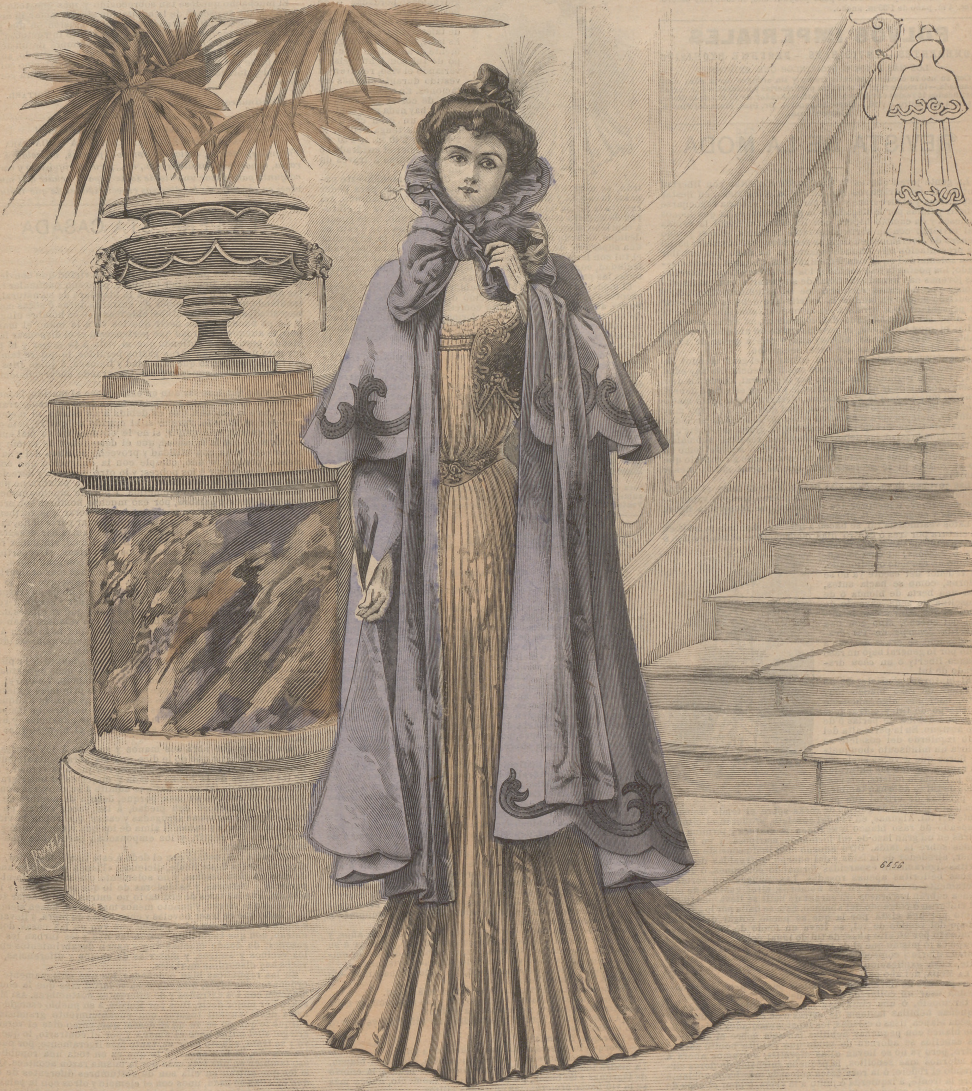
Salida de teatro ó de baile.

SUSCRIPCIÓN 6 Meses. 1 AÑO. En toda España. 4 pts. 7'50