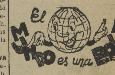
El mundo es una bola

SAIGON, 20. — Aviones de reconocimiento franceses registraron esta madrugada nuevos movimientos de fuerzas rebeldes en la zona fronteriza con la China comunista. Se teme un ataque de los rebeldes contra Cao bang, a treinta kilómetros al Noroeste del puerto de Dongkhe, que ocuparon ayer. También se prevé un ataque de los comunistas del Viet Minh en Laokay, donde se registran concentraciones de los rojos. (Efe.)