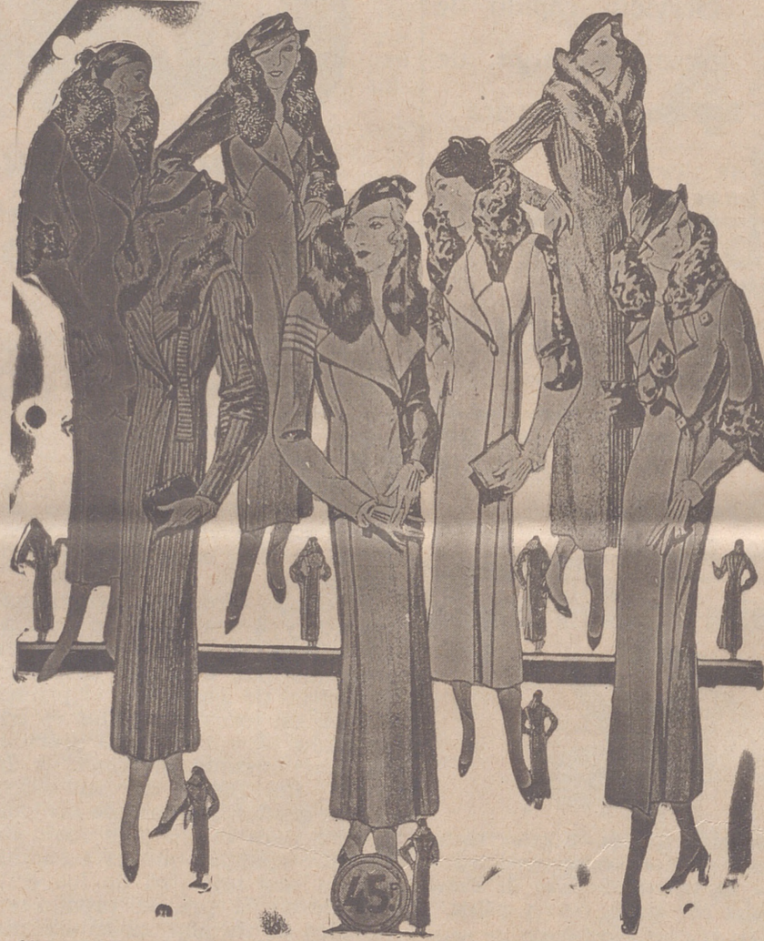
Abrigos señora, modelos novedad, a 20, 25, 30, 40, 50 y 60 pesetas. Abrigos para niñas, de 10, 12, 15 y 20 ptas. LA CASA MAS SURTIDA Y MAS BARATO VENDE

Primera casa en confecciones para caballero, señora, jóvenes y niños Tejidos, Pañería y Sastrería