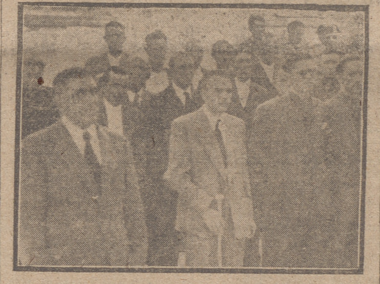
Las viviendas de Santiago del Arroyo