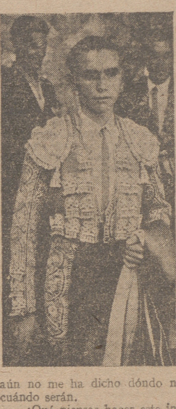
aún no me ha dicho dónde ni cuándo serán. —¿Qué piensas hacer este invierno? —Ime a algunas tientas en unas ganaderías que me han