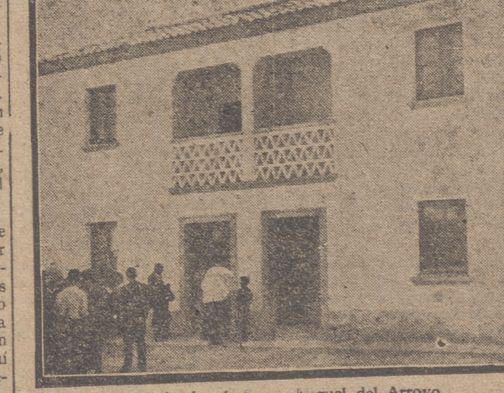
Viviendas de San Miguel del Arroyo