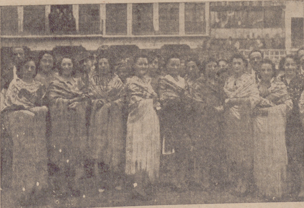
Un grupo de bellísimas muchachas ataviadas con mantones de Manilla en el tradicional baile de la Plaza, durante las fiestas de Tordesillas