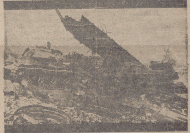
Durante un empeñado ataque ruso a un determinado sector alemán, numerosos tanques se amontonaron destruidos en el mismo lugar, sin lograr su objetivo