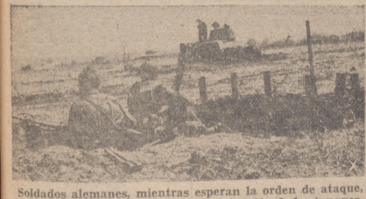
Soldados alemanes, mientras esperan la orden de ataque, contemplan desde la trinchera la actuación de los tanques.