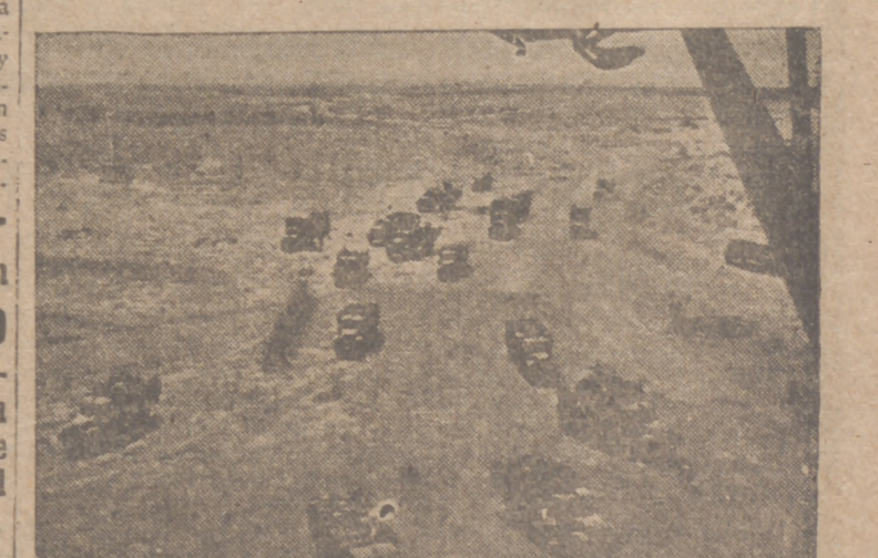
Desde avión a camiones.—Tropas y material, llegados a África en avión, son llevados en camiones a los puntos avanzados