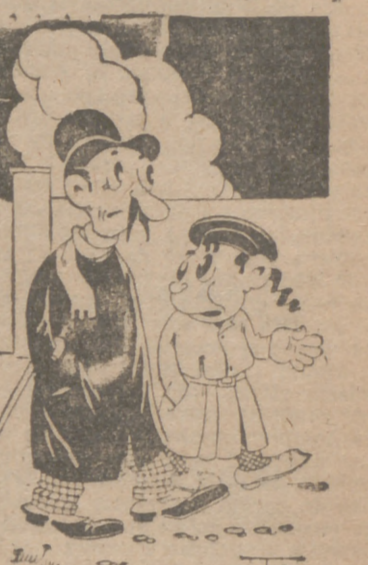
—Los de Baracaldo han estado entusiasmados y decididos, pero si hubieran visto, Chinito, a los "dacoits"!

del partido, ya no era lo mismo; ya empujaba el Baracaldo y sus escapadas eran peligrosísimas. El "once" local fué siempre por delante del marcador, pero dejando ver lo inseguro de su ventaja. El Baracaldo A. H. es un equipo joven. Lo componen once muchachos a quienes les sobra de ánimo lo que por hoy les falta de juego. Y como otros muchos de los que por aquí pasaron, es de esos equipos en que todos corren detrás del balón, todos atacan o todos defienden según se vaya necesitando. Acertado el portero en sus intervenciones. El resto, en un mismo tono, del que sólo destacamos al interior izquierda, que supo lanzar peligrosos tiros. Del Valladolid está dicho casi todo. Estuvo mal. Francamente mal. Pero lo grave de esto es que creemos que, queriendo, puede estar mejor. Y ante esto, la afición, que supo responder en todo momento, se siente defraudada y comienza a retraerse. ¿Por qué va a aguantar, domingo tras domingo, espectáculos parecidos? Que piensen esto los jugadores, y si sienten algo por el Club o simplemente por Valladolid, sepan arrepentirse a tiempo. Y que no olviden algunos que la "hinchada", con la misma facilidad que crea ídolos sabe destruirlos. Del naufragio general se salvó únicamente Ispizua. La defensa falló bastante, aunque queda anudado a favor de Busquet aquel avance que originó el segundo gol. En la media, únicamente León, y en la delantera pusieron algo de interés Sañudo y Carolo.