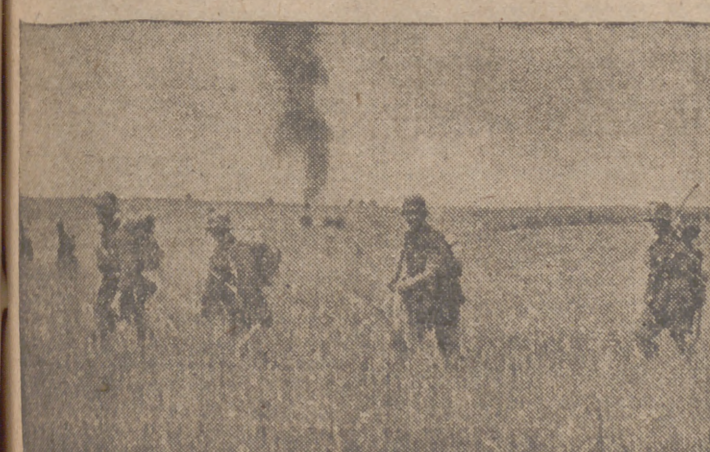
Infantería alemana hacia posiciones avanzadas en Rusia