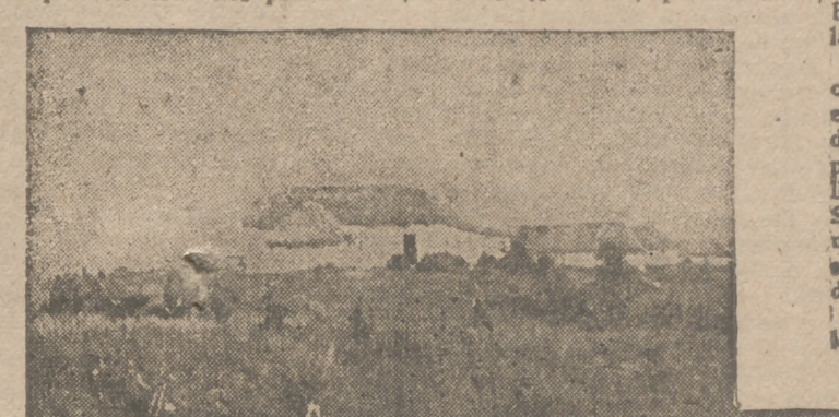
Para las tropas del Eje no existen obstáculos en Rusia. El avance prosigue, pese a las innumerables dificultades que encuentran a su paso.

Hemos sabido también que el Palacio de los Soviets, que estaba en mármol, con estos espejos venecianos y con todos estos objetos que son los últimos testimonios de un lujo abolido?