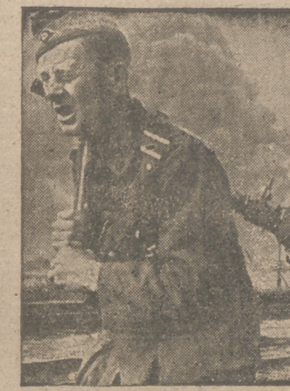
Este valiente soldado alemán consiguió derribar con su ametralladora un avión de exploración soviético. En los rostros de ambos léense las calamidades de los combates