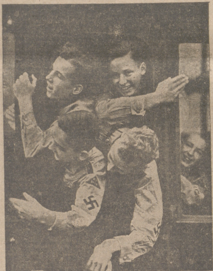
La juventud del Reich, optimista y gorriza, se dirige a los campamentos

Madrid, 24.—Se convoca a todos los profesionales del periodismo que, careciendo de carnet, solicitaron seguir los cursos de la Escuela en la convocatoria d. noviembre de 1941 y que han de examinarse a partir del próximo día 26, para que se presenten en el domicilio de la Escuela (Avala, 5) dicho día, a las once de la mañana. — Delegación Nacional de Prensa.