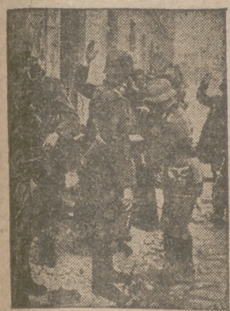
Registros y detenciones en los barrios ocupados rusos.

Moscú entretiene el hambre con las películas de Gary Cooper y Dorothy Lamour. Calles de cincuenta metros de anchura que parecen desiertos. La gente no sabe qué hacer con sus rublos "febricos"