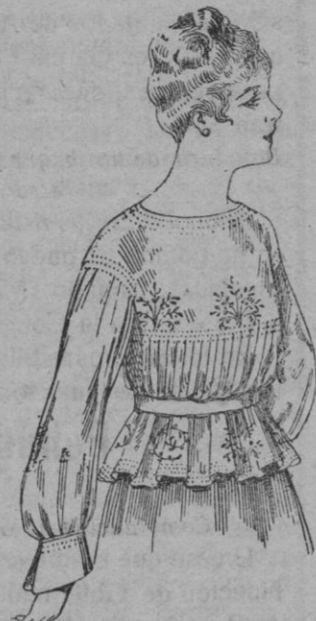
Busa de crepón de se- da, negro, azul y colores De pts. 33 a 35