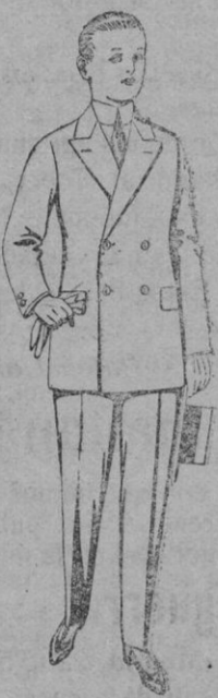
Traje de estambre vicu- ña o jerga, para juvenes de 10 a 16 años De pts. 19 a 50