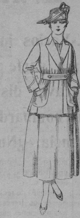
Trajes de estambre ne- gro, azul y color De pts. 70 a 75