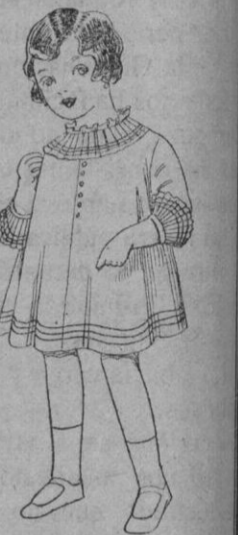
Vestido de volé blanco bordado De pts. 6'75 a 8