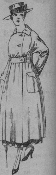
Guardapolvo de drill bel- ge, manga Reg'nd., a pts. 23