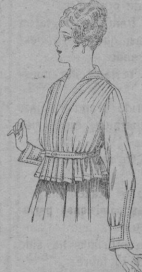
Blusa brista blanca a pts. 5'75