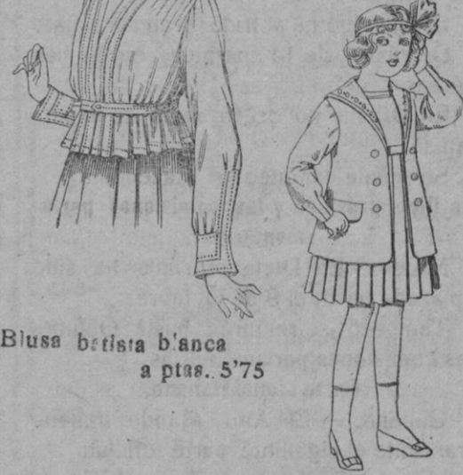
Traje de gabardina b'an- co, cuello de organdio bordado, para niñas de 4 a 9 años De pts. 22 a 24