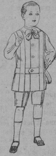
Trajes de linilla, para ni- ños de 4 a 9 años De pts. 12 a 31