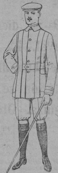
Cazadores de drill crudo o kaki De pts. 12 a 20 Pantalones cortos para sportman de drill beige De pts. 8 a 12