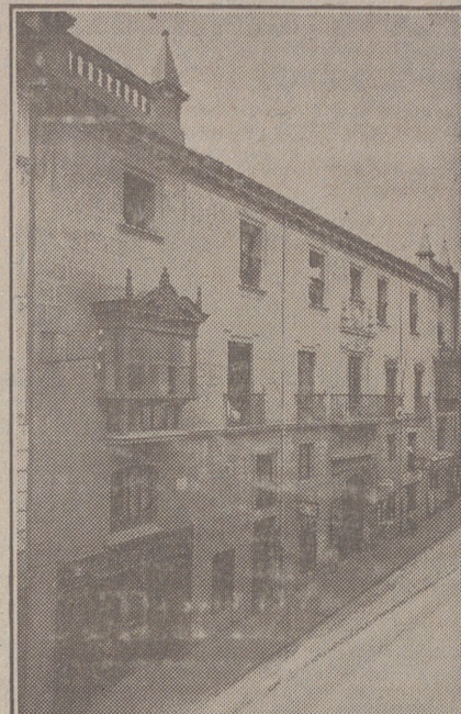
Fachada, por la calle de Santander, 10, 12 y 14, de la CASA SOCIAL propiedad de la Federación Burgalesa de Sindicatos Agrícolas Católicos.

En ella están las Oficinas de la FEDERACIÓN, CAJA DE AHORROS, MUTUALIDAD AGRICOLA BURGALESA y Redacción y administración de «El Castellano» y «El Defensor de los Labradores».